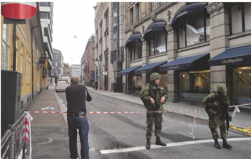
Die Armee sperrt die Zufahrtswege zum Regierungsviertel.