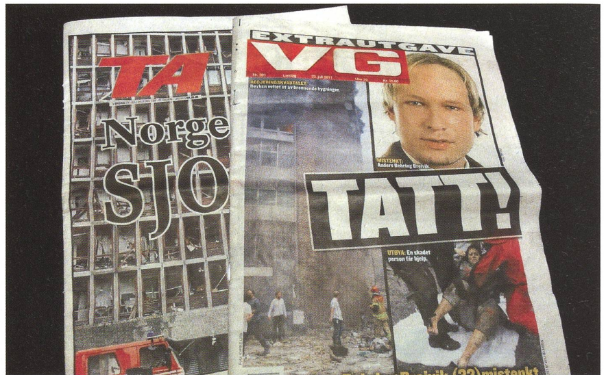
Trotz erschwelter Bedingungen berichteten die norwegischen Tageszeitungen bereits wenige Stunden nach der Tat ausführlich, informativ und bildreich.

Von der ersten Minute an berichteten die Medien rund um die Uhr über alle verfügbaren Kanäle. Jede neue Nachricht wurde sofort verbreitet und am Fernsehen mittels Bauchbinden immer wieder wiederholt. BBC und Deutsche Welle übernahmen die verfügbaren Bilder, beauftragten eigene