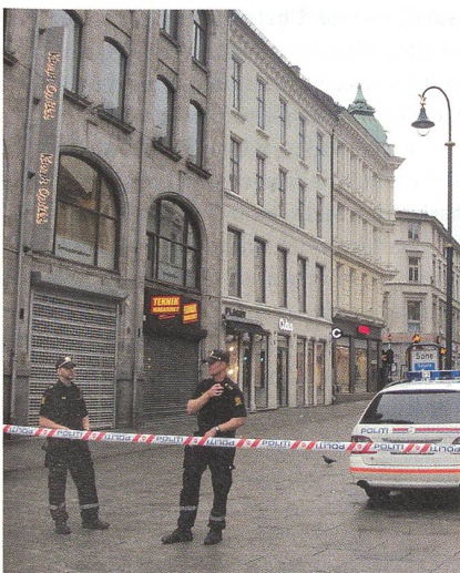
Erste Strassensperren von der Polizei.