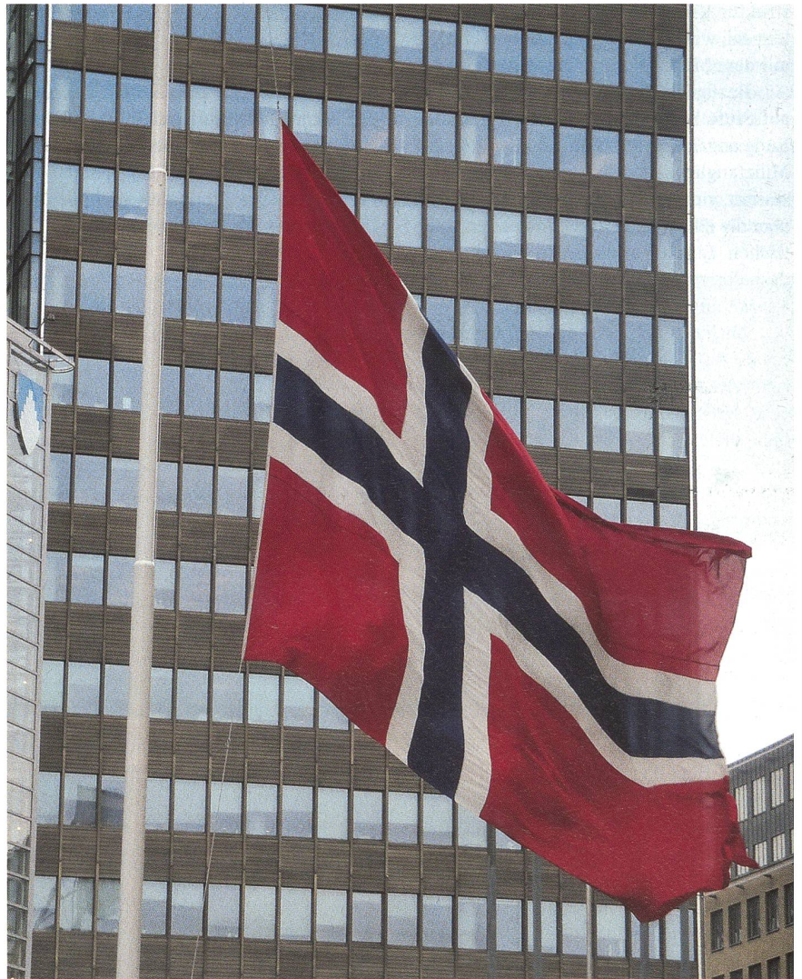
Die norwegische Fahne steht im ganzen Land auf Halbmast.

Ein freundlicher Norweger übersetzte uns die Zeilen, bis er stockte, leer schluckte und sagte: «Es werden weitere Bomben ver-