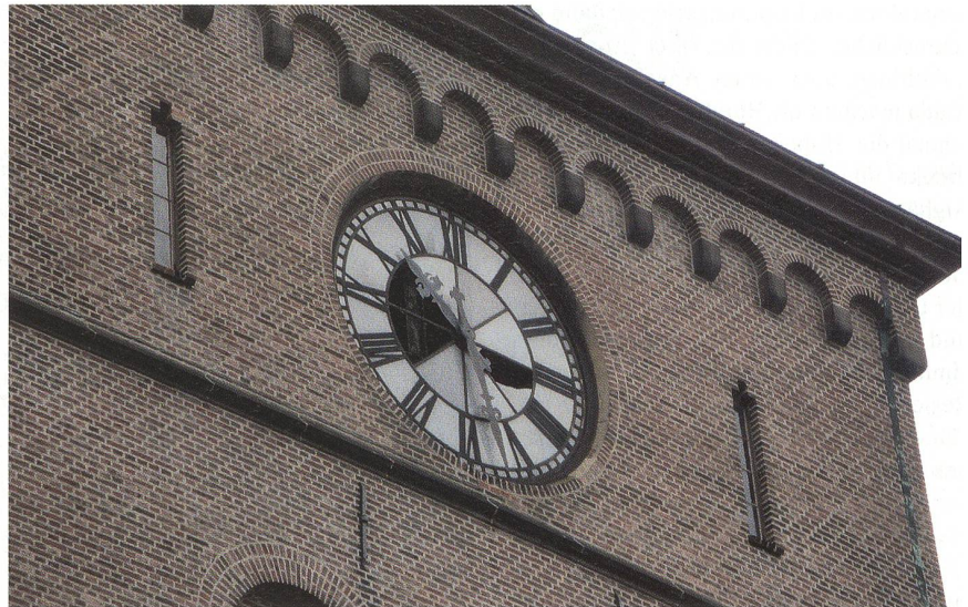
Das beschädigte Zifferblatt der Osloer Kathedrale.