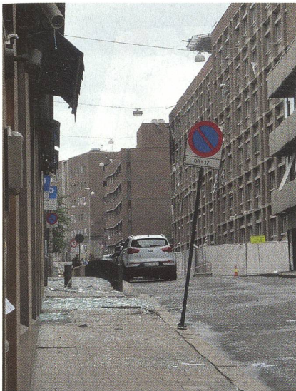
Scherben und beschädigte Fassaden.