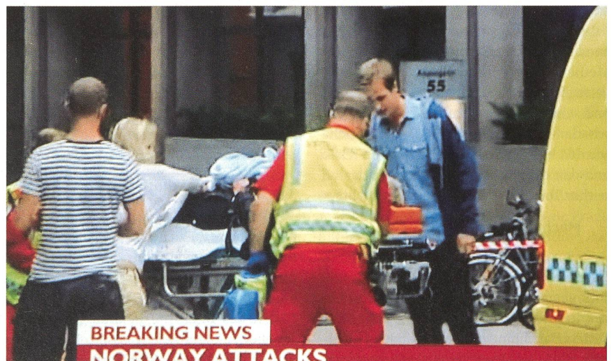
Das Fernsehen liefert auf allen Kanälen Beiträge über das Attentat in Oslo.