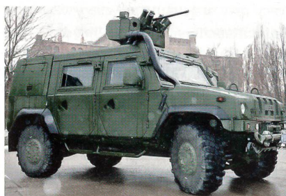
Fahrzeug Iveco LMV M65 Lynx.

Von der grösseren Einkaufsmenge verspricht sich das Militär einen niedrigeren Preis: 16,4 Millionen Rubel (ca. 410 000 Euro) pro Fahrzeug anstatt der derzeitigen 20,3 Millionen Rubel (ca. 507 000 Euro). Mit den Fahrzeugen sollen zehn neue Aufklärungsbrigaden sowie die Luftlande- und Sturmverbände ausgestattet werden. Obwohl die italienischen Fahrzeuge nicht zum Luftlanden geeignet sind und tiefe Wassersperren nicht überqueren können, sollen