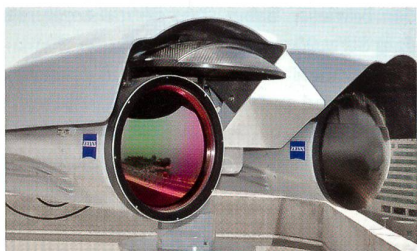
Sensoreinheit von Z:NightOwl.

Mit stabilisierten und verschiedenen leistungsfähigen Sensoren und einem Beobachtungsbereich von 360° vereint es erstmals eine hochauflösende Wärmebildkamera, eine Tagsichtkamera in HD-TV-Qualität und einen präzisen augensicheren Laserentfernungsmesser. Z:NightOwl erreicht extrem hohe Reichweiten und bis zu 30 Kilometern, um Grenzen und Küsten sowie kritische Infrastrukturen bestmöglich zu überwachen und zu schützen. Je nach Bedarf können erfasste Objekte mittels des augensicheren Laserentfernungsmessers in bis zu 40 Kilometern Entfernung genau positioniert auf einer geografischen Karte dargestellt werden. Die offenen Schnittstellen