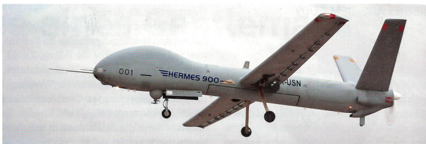
Die neue Mehrzweckdrohne Hermes 900.

Elbit Systems hat die nächste Generation von Multirole MALE (Medium Altitude Long Endurance) UAS (Unmanned Aircraft Systems), die Drohne Hermes 900, entwickelt und dafür bereits erste Kunden in Europa gewonnen. Die neue Mehrzweck-Drohne kann zur Gebietsüberwachung, gezielten Aufklärung und Überwachung, zur elektronischen Aufklärung/Datensammlung, Zielzuweisung, Seeraumüberwachung oder auch zur Bodenunter-