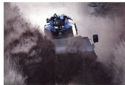
Fernbedienbare Waffenstation TRT 25.

Die slowakischen Streitkräfte haben für ihre gepanzerten Truppentransporter eine neue fernbedienbare Waffenstation gesucht, die das Einsatzspektrum erweitert.