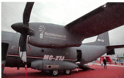
30mm-Geschütz der neuen MC-27J.

Alenia Aermacchi hat anlässlich der Luftfahrtausstellung in Farnborough eine neue Version des C-27 Transportflugzeugs vorgestellt. Die MC-27J ist nicht nur ein Gunship, sondern eine einsatzerprobte Plattform mit bewährter Sensorik, Kommunikations- und Waffensystemen ausgestattet, welches in der Lage ist, eine breite Palette von kundenorientierten Missionen auszuführen. Die MC-27J ist so konzipiert, Luftstreitkräfte und Special Forces bei der Durchführung von mehreren wichtigen Einsätzen, einschliesslich der Unterstützung von Anti-Terror-Missionen, der Evakuierung von Soldaten und Zivilbevölke-