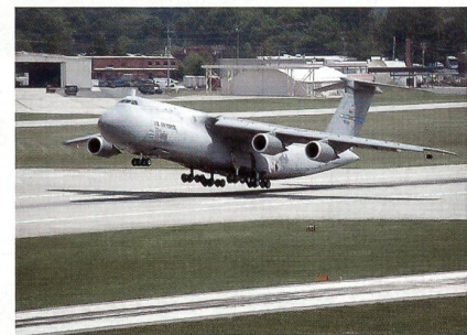
Das US-Transportflugzeug Galaxy.

Im Juli hat Lockheed Martin die fünfte C-5M Super Galaxy der US Air Force übergeben; es handelt sich dabei um die achte umgebaute Galaxy. Bei dem C-5M Super Galaxy handelt es sich um eine mit modernen Triebwerken und zeitgemässer Cockpit Avionik nachgerüstete C-5 Galaxy. Das CF6-80C2 Triebwerk liefert eine um 22 Prozent höhere Schubkraft und führt bei dem