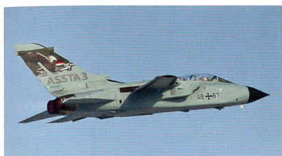
Deutscher Tornado ASSTA 3.0.

Bis 2018 ist die Umrüstung aller 85 im zukünftigen Bestand der Luftwaffe eingesetzten Tornados auf diesen Standard geplant. ASSTA 3.0 beinhaltet neben der Integ-