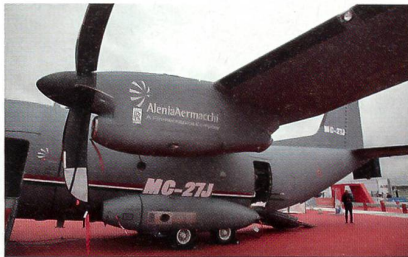
30mm-Geschütz der neuen MC-27J.

Alenia Aermacchi hat anlässlich der Luftfahrtausstellung in Farnborough eine neue Version des C-27 Transportflugzeugs vorgestellt. Die MC-27J ist nicht nur ein Gunship, sondern eine einsatzerprobte Plattform mit bewährter Sensorik, Kommunikations- und Waffensystemen ausgestattet, welches in der Lage ist, eine breite Palette von kundenorientierten Missionen auszuführen. Die MC-27J ist so konzipiert, Luftstreitkräfte und Special Forces bei der Durchführung von mehreren wichtigen Einsätzen, einschliesslich der Unterstützung von Anti-Terror-Missionen, der Evakuierung von Soldaten und Zivilbevölke-