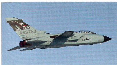
Deutscher Tornado ASSTA 3.0.

Bis 2018 ist die Umrüstung aller 85 im zukünftigen Bestand der Luftwaffe eingesetzten Tornados auf diesen Standard geplant. ASSTA 3.0 beinhaltet neben der Integ-