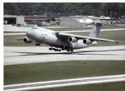
Das US-Transportflugzeug Galaxy.

Im Juli hat Lockheed Martin die fünfte C-5M Super Galaxy der US Air Force übergeben; es handelt sich dabei um die achte umgebaute Galaxy. Bei dem C-5M Super Galaxy handelt es sich um eine mit modernen Triebwerken und zeitgemässer Cockpit Avionik nachgerüstete C-5 Galaxy. Das CF6-80C2 Triebwerk liefert eine um 22 Prozent höhere Schubkraft und führt bei dem