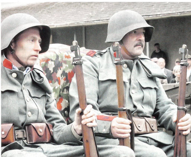
27er Kanoniere mit Stahlhelm und der roten Waffenfarbe.