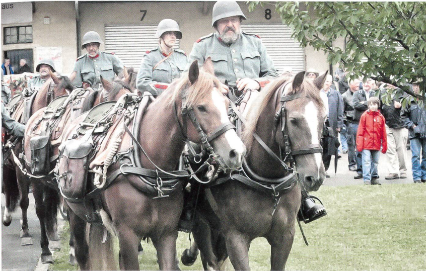
Der Einzug der pferdegezogenen, sechsspännig gefahrenen 7,5 cm Feldkanone 03/12.