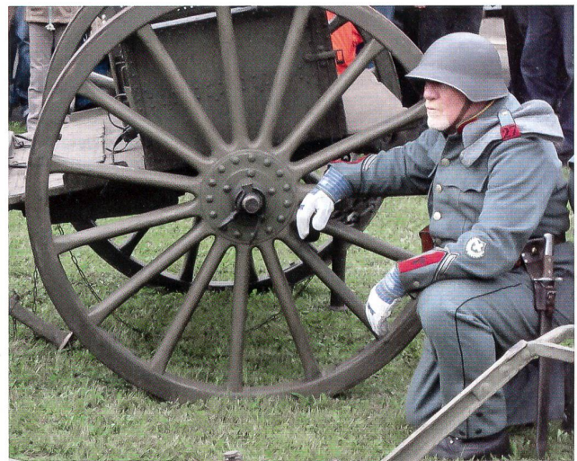
Der Geschützführer-Wachtmeister – mit Gold am Kragen.