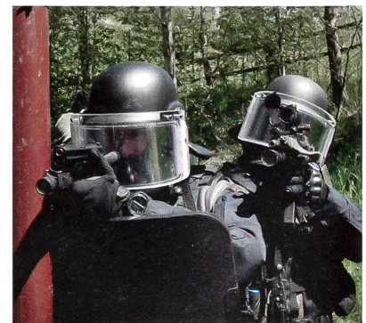
Kämpfer des MP Spez Det im Einsatz.

Die erste Verlängerung lag in der Befugnis des Bundesrats. Die nächste wäre dann wieder Sache des Parlaments.