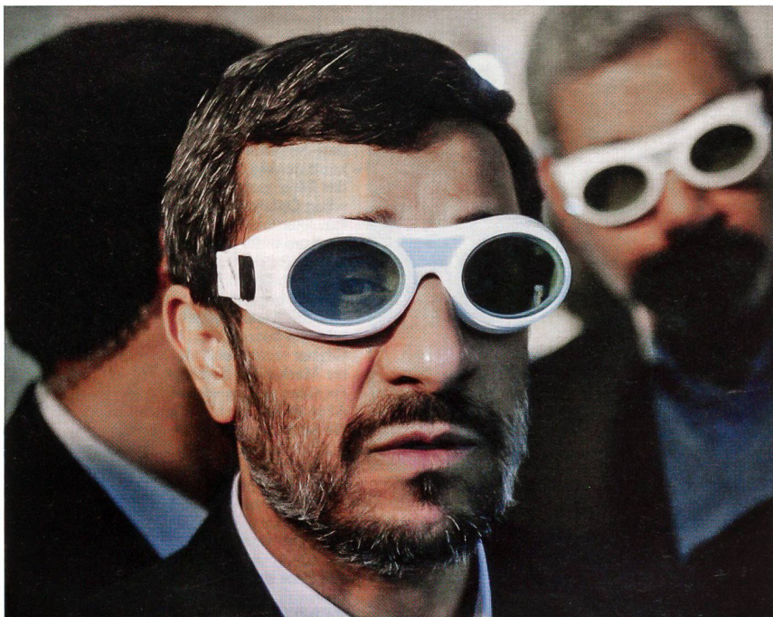
Der iranische Präsident Ahmadinedschad, gut geschützt bei einer Laser-Vorführung.

Eine Zerstörung hätte also die Verstrahlung grosser Gebiete des Iran, aber auch von Teilen angrenzender Golfstaaten zur Folge.