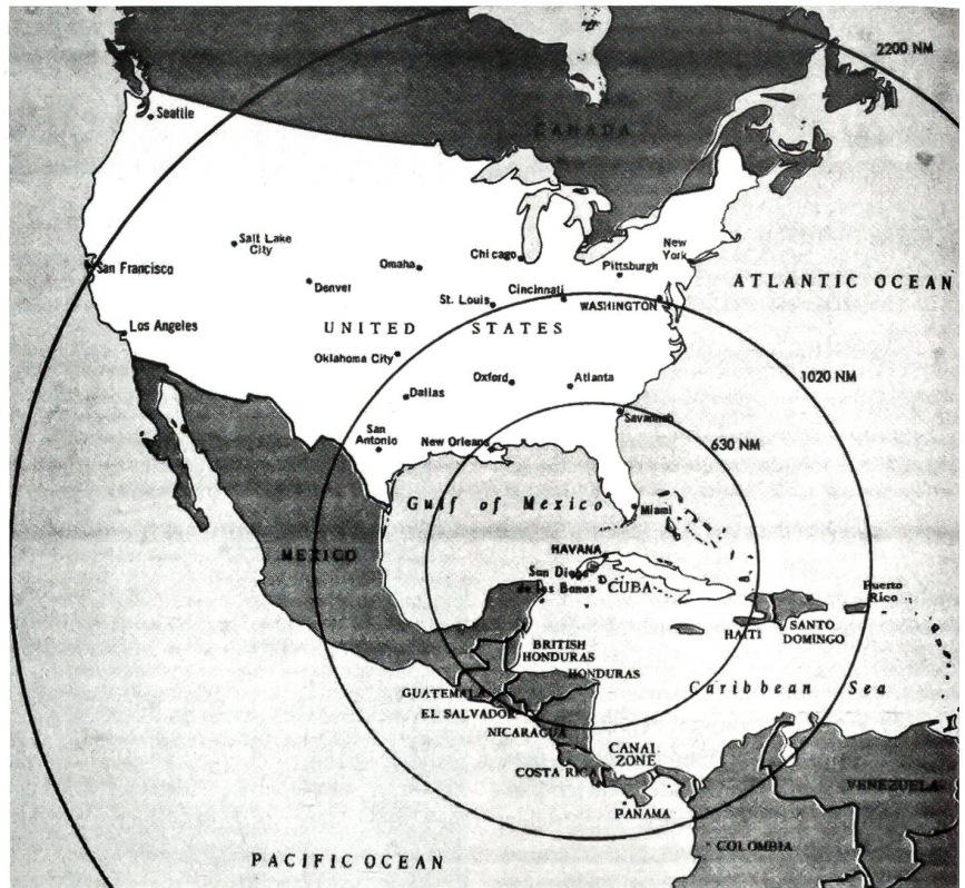
Die Reichweiten der SS-4 und SS-5. Der grössere Radius der SS-5 Slean mit etwa 3500 km deckt praktisch die ganze USA ab, jener der SS-4 Sandal reicht immerhin bis zur Hauptstadt Washington D.C.

Kennedy stand nach Vorliegen eindeutiger Beweise der Stationierung von sowjetischen Raketen auf Kuba unter massivem Druck. Sein Beraterteam war gespalten. Die einen, Zivilisten und Militärs («Falken»), unter ihnen speziell der Stabschef der Luftwaffe General LeMay, empfahlen eine unverzügliche Ausschaltung der Raketenbasen oder gar eine Invasion.