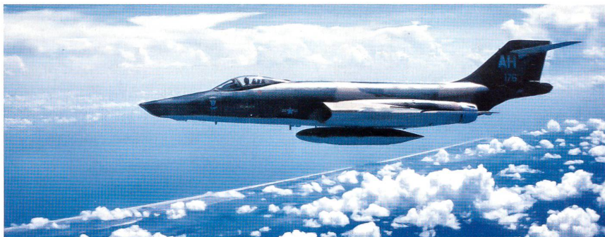
Aufklärer der US Air Force RF-101 Voodoo auf dem Flug nach Kuba.

Ebenfalls vor der Ankündigung hatte Admiral Dennison, der Befehlshaber der Atlantikflotte, den Einsatzbefehl für die Quarantäne erhalten. Diese sollte auf Mittwoch, 24. Oktober 1962, um 10 Uhr in Kraft treten und rund um Kuba mit vorerst zwölf Zerstörern der Task Force 136 eine «Sperr» in einem Radius von 900 km errichten. Für die US-Streitkräfte wurde am 22. Oktober die