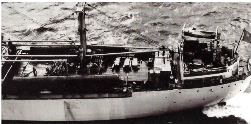
Das Transportschiff Bratsk führt abgebaute Raketen in die Sowjetunion zurück.

Bemerkenswert ist auch die Tatsache, dass die gesamte Meinungsbildung weitgehend abgeschottet von der Öffentlichkeit und den Medien verlief. Diese hatten zu diesem Zeitpunkt nie voll erkannt, was effektiv ablief und auf dem Spiele stand. Entsprechend waren Druckversuche von dieser Seite eher limitiert. Etwas, was heute vermutlich kaum mehr denkbar wäre. +