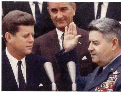
Zwei Gegenspieler, links Präsident Kennedy und rechts General Curtis LeMay, der Stabschef der US Luftwaffe, der von Beginn weg die Raketenstellungen auf Kuba bombardieren wollte. In der Mitte Vizepräsident Johnson.

Die Vereinigten Stabschefs unter Führung von General Maxwell D. Taylor, den Stabschefs der Luftwaffe Curtis LeMay und des Heeres General Earle G. Wheeler (erst seit September 1962), dem Chief of Naval Operations Admiral George W. Anderson