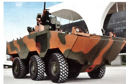
Radschützenpanzer Iveco-6x6-Guarani der brasilianischen Streitkräfte.

Seit 2009 ist Iveco vom brasilianischen Heer beauftragt, 2044 amphibische und geschützte Trabsportfahrzeuge zu liefern. Der 6x6 Guarani ist eine 18-Tonnen-Plattform für eine elfköpfige Besatzung, angetrieben von einem Dieselmotor mit automatischem Getriebe. Das Fahrzeug ist mit Flugzeugen