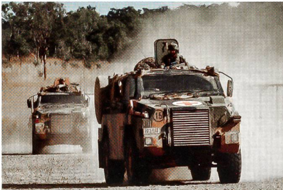
Geschütztes Fahrzeug Bushmaster der australischen Streitkräfte.

Die australische Regierung hat angekündigt, 214 weitere Bushmaster für das Heer zu beschaffen. Thales Australia wird die geschützten 4x4-Fahrzeuge ausliefern. Die Ende der 90er-Jahre erstmals eingeführten Bushmaster wiegen rund 12,5 Tonnen und