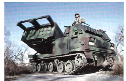
Die mechanisierten Mehrfachraketenwerfer M270A1 der US Army werden kampfwertgesteigert.

Lockheed Martin wurde von der U.S. Army beauftragt, den Schutz des Mehrfachraketenwerfers M270A1 (MLRS) zu verbessern. In der Phase 1 des Drei-Jahre-Programms erhalten die Kabinen von sieben MLRS-