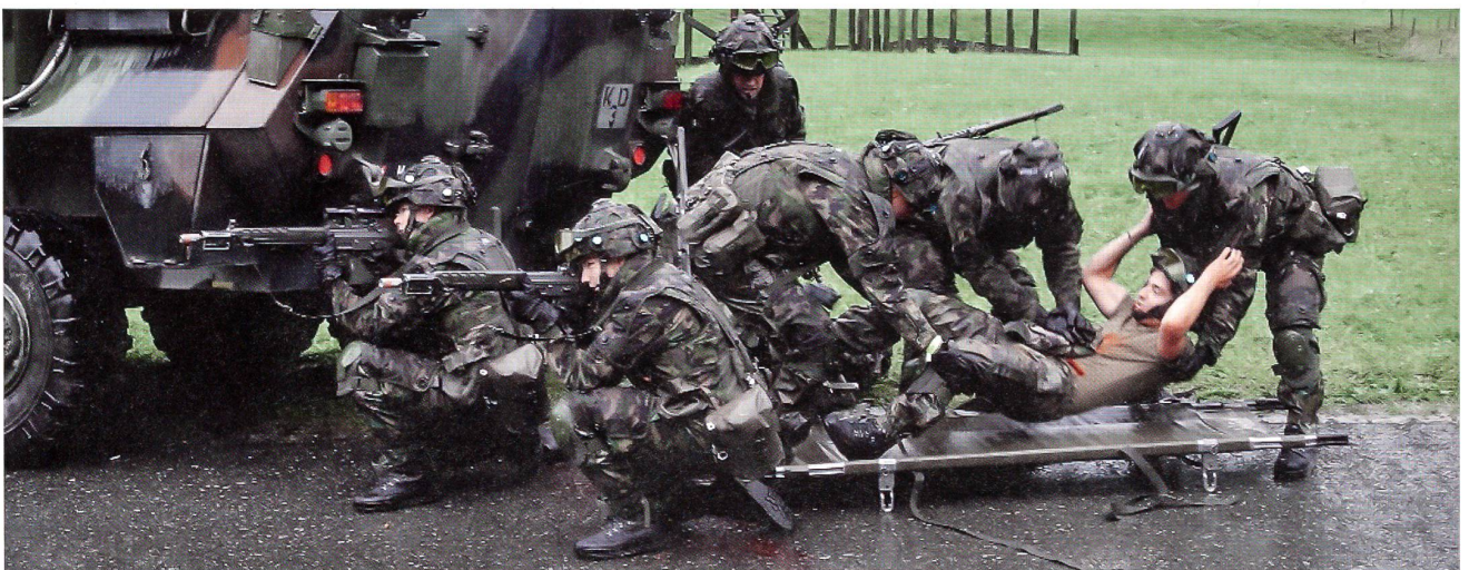
Die Planung für die Armee 2016 ist vorangekommen: Künftig sollen alle Wehrpflichtigen nur noch fünfmal in den WK einrücken.