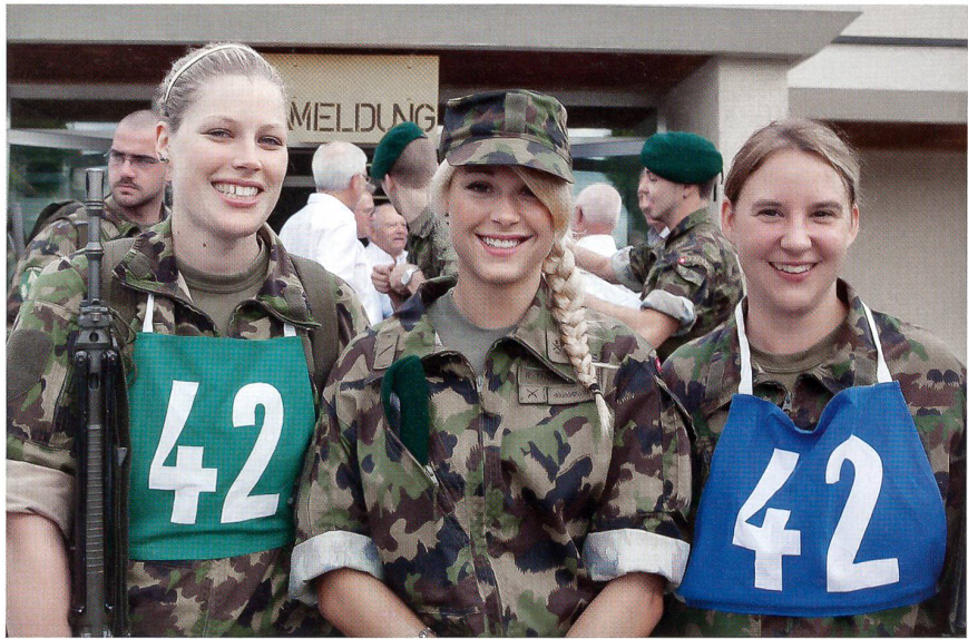
Strahlende Gesichter an den Schweizer Unteroffizierstagen 2012 in Ins.

Im Gelände Handgranatenwerfen, Distanzenschätzen und in einem Schützenstand im Wald waren die Söhne und Töchter