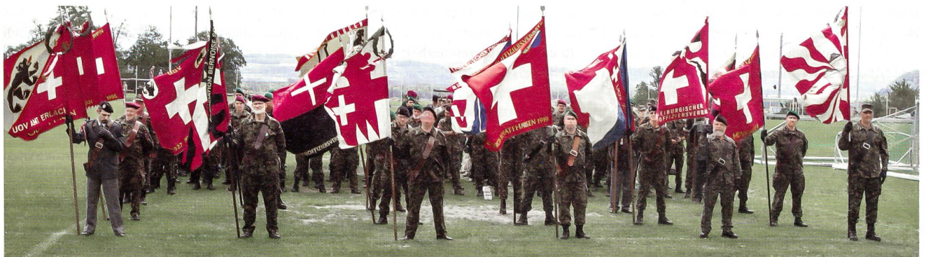
Das Fahnenmeer: Immer wieder ein bewegendes, ergreifendes Bild – hier im August 2012 in Ins.