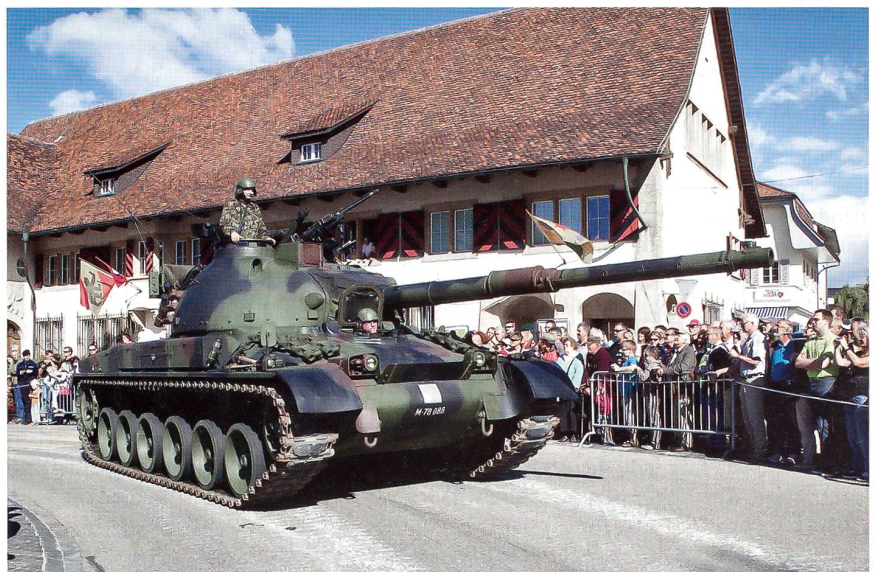
Panzer aus der Zeitgeschichte der Armee rollen durch Ins.

Das OK hatte bis ins kleinste Detail an alles gedacht. An den Wettkampftagen waren 350 Mitglieder des UOV Amt Erlach im Einsatz, teilweise unterstützt von Angehörigen. Dazu rund 100 Personen, die nicht im UOV Amt Erlach Mitglied sind. Das Zentrum war die Sporthalle Ins.