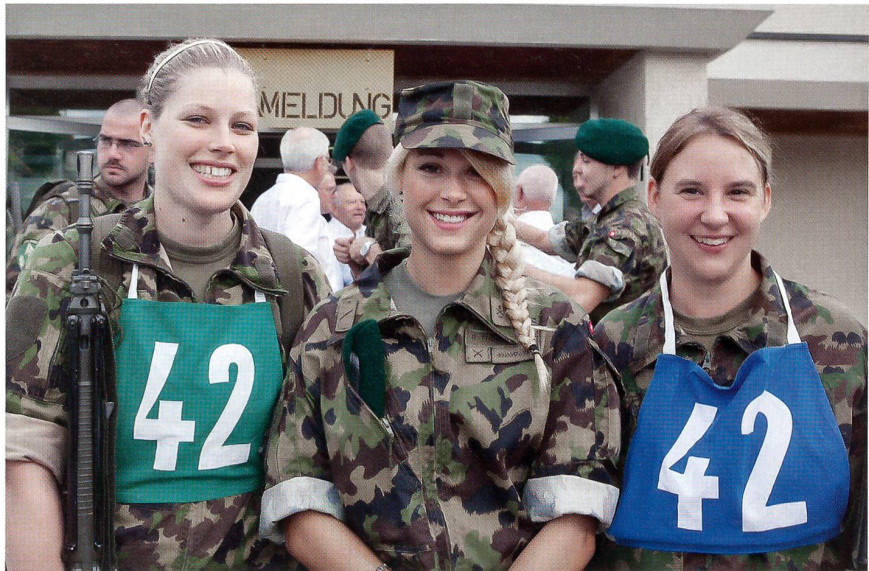
Strahlende Gesichter an den Schweizer Unteroffizierstagen 2012 in Ins.

Im Gelände Handgranatenwerfen, Distanzenschätzen und in einem Schützenstand im Wald waren die Söhne und Töchter