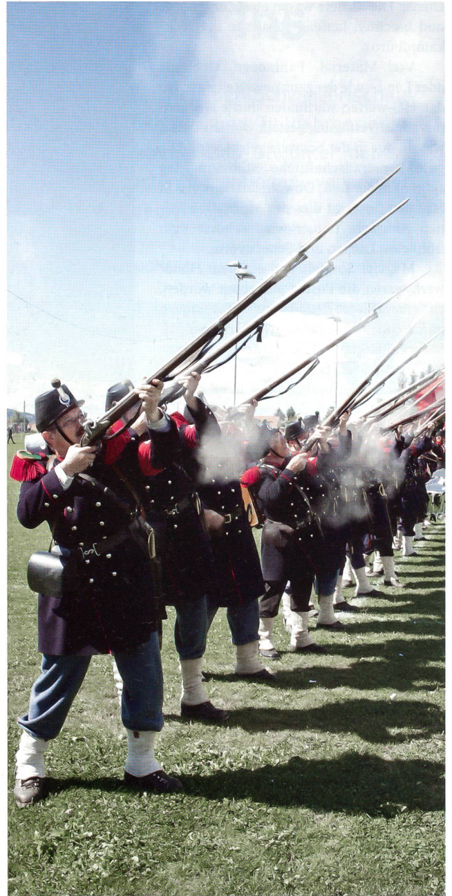
Auch das gehört dazu: Tradition wird hochgehalten, die Cp 1861.