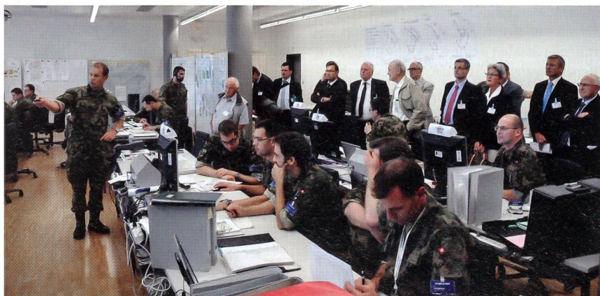
Zahlreiche Gäste beobachten die Übung «STABILO DUE».