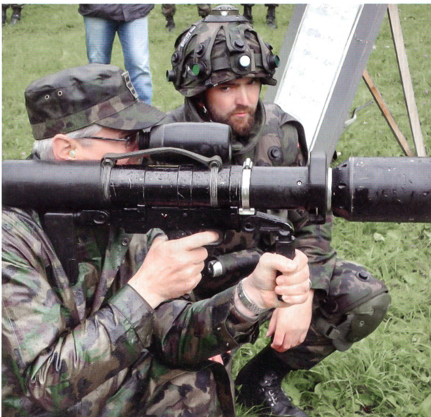
Das Schiessen mit der Panzerfaust will gelernt sein.