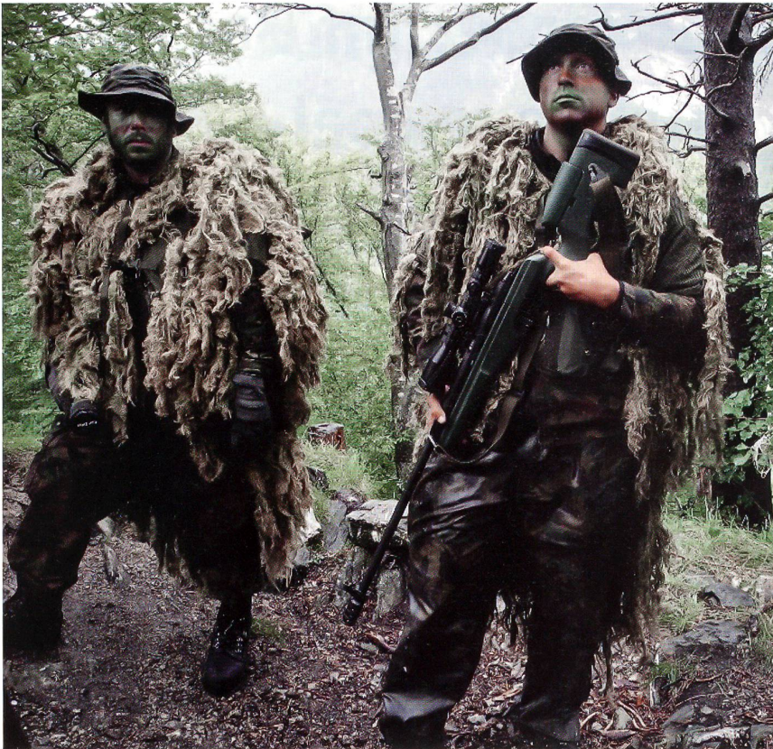
Zwei gut getarnte Scharfschützen.