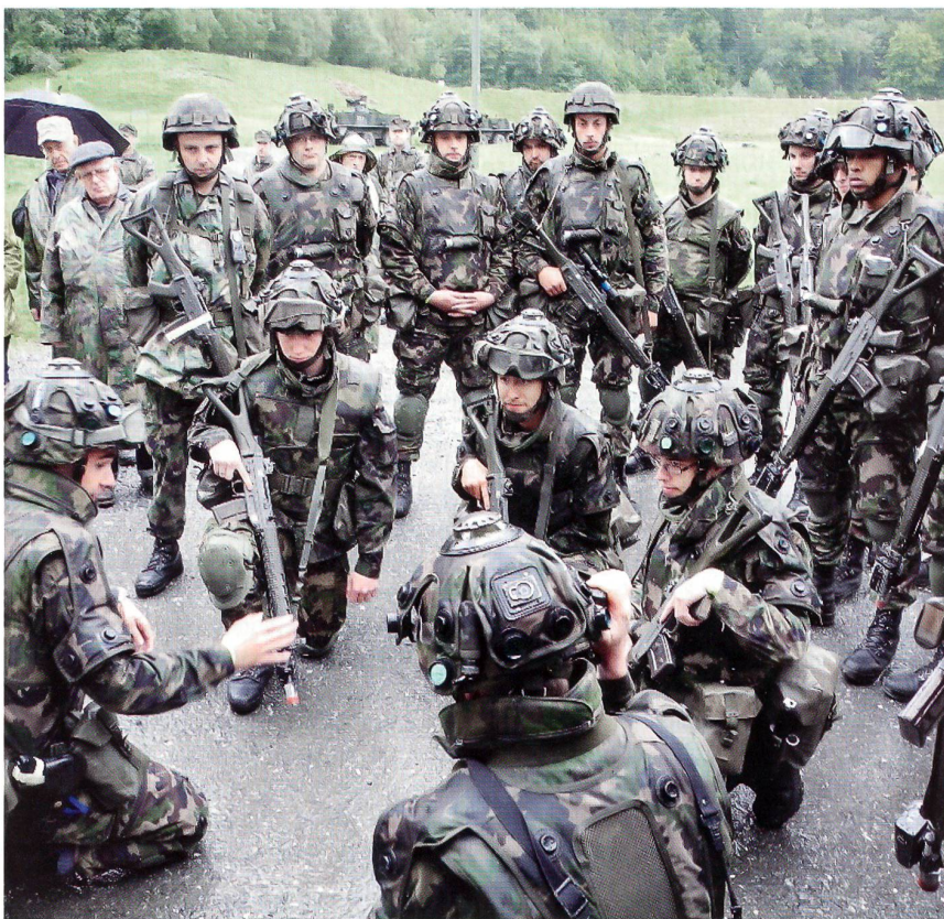
Der Zugführer scharft seine Männer um sich.