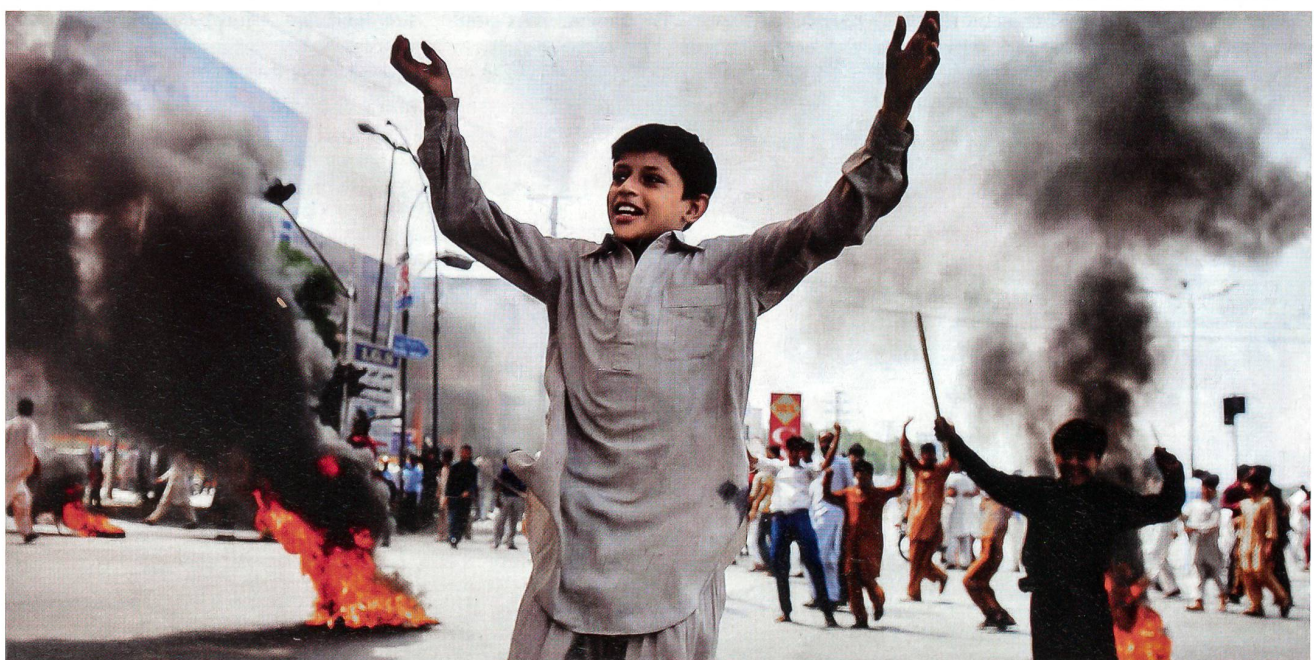
Proteste im pakistanischen Rawalpindi: «Pflicht ist das Töten des Regisseurs, des Produzenten, der Schauspieler.»