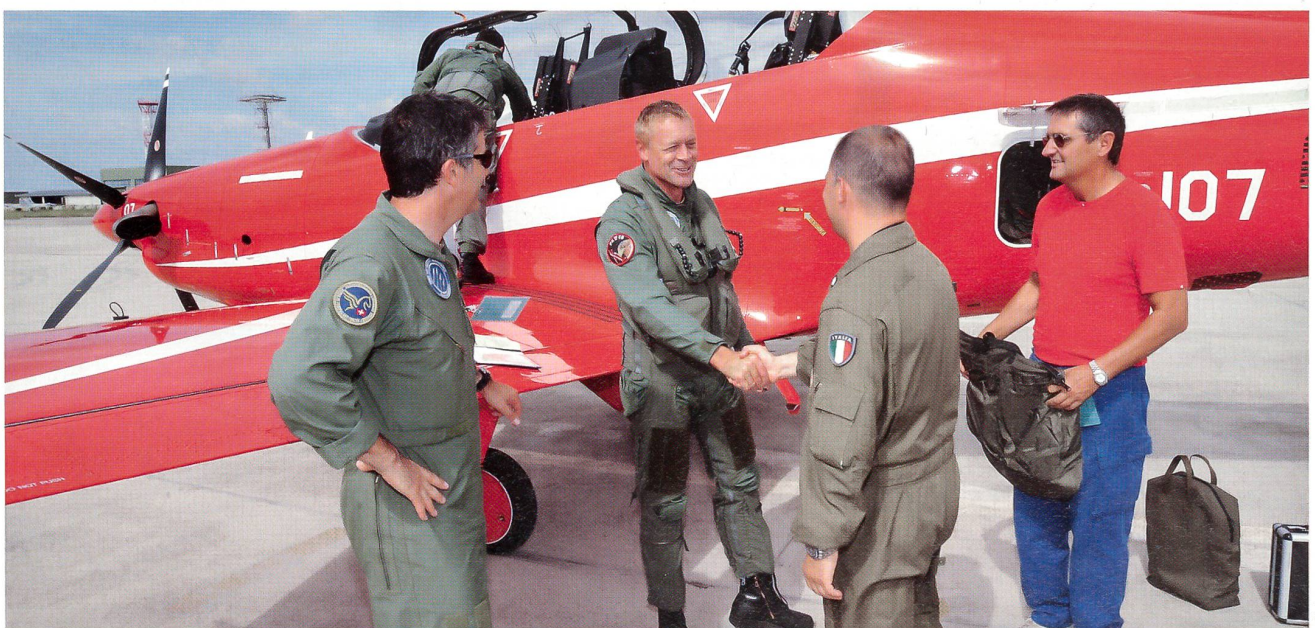
Freundschaftlich-kameradschaftliche Begrüssung im italienischen Galatina bei Lecce.