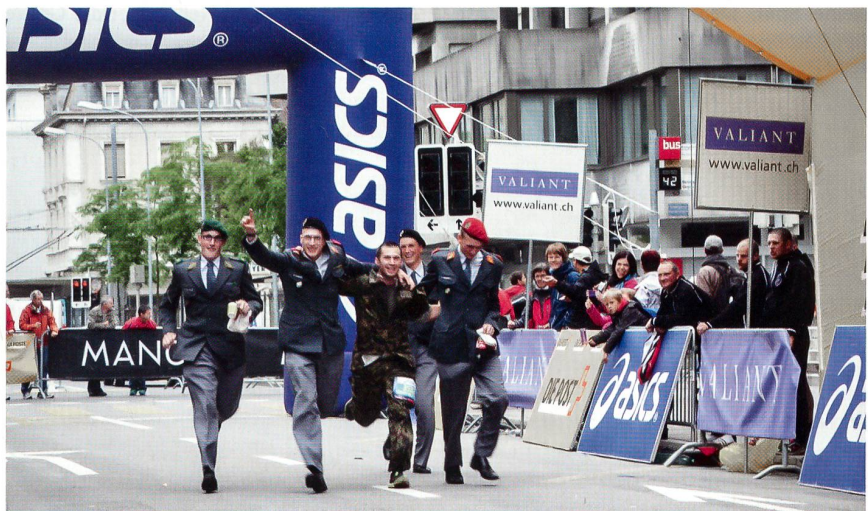
Geschafft: eine ganze Staffel empfängt den Schlussläufer am Ziel.