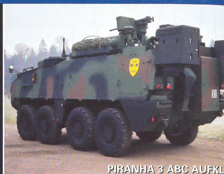
PIRANHA 3 ABC AUFKLA