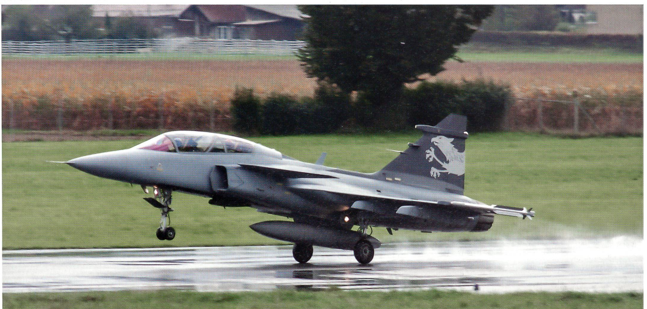
Bei regnerischem Wetter startet das schwedische Flugzeug, der Gripen Demonstrator, in Emmen.

Bei planmässigem Verlauf des Gripen-Geschäfts würden die ersten der 22 vorgesehenen Gripen E im Jahre 2018 in der Schweiz eintreffen. ✚