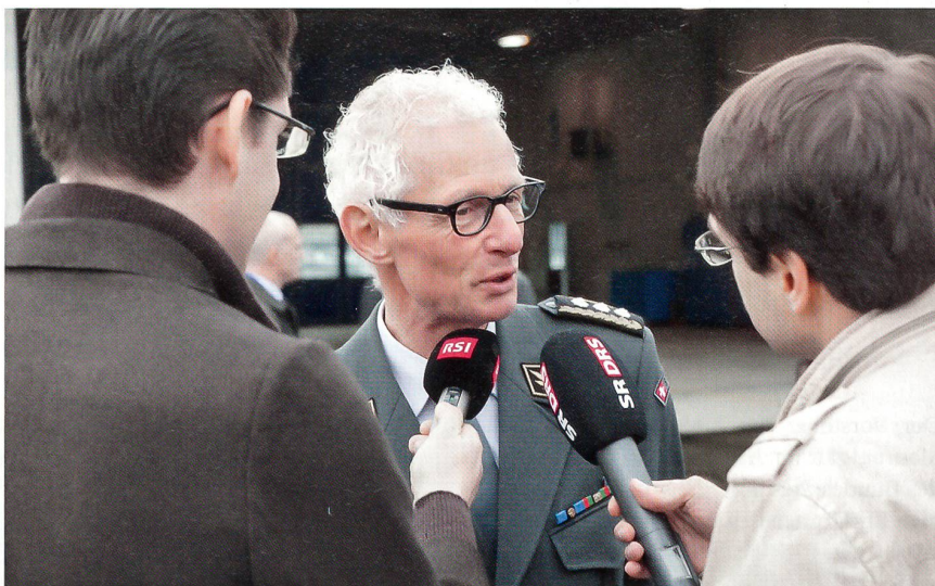
Korpskommandant Markus Gygax, bis Ende 2012 Kommandant der Schweizer Luftwaffe, steht den zahlreich erschienenen Medien Red und Antwort.