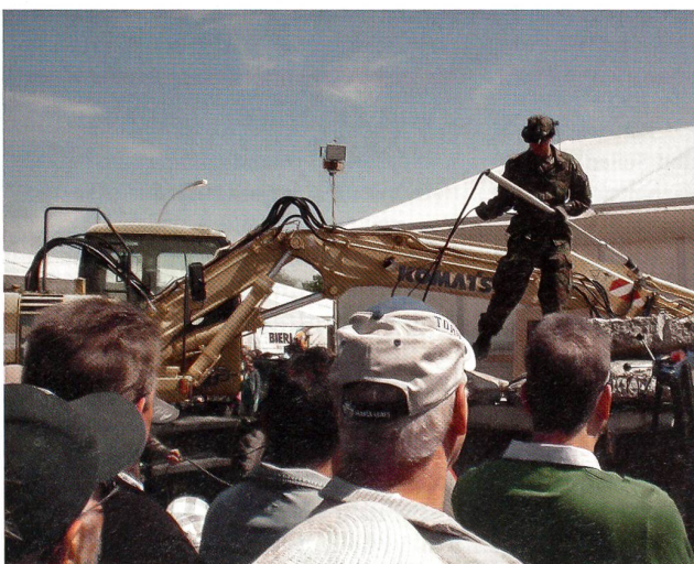
Mit der Video-Verschütteten-Such-Ausrüstung (VVSA) wird der Verschüttete geortet.