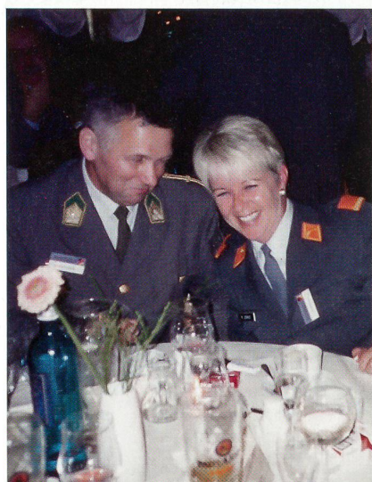
Mit einem österreichischen Stabschef.