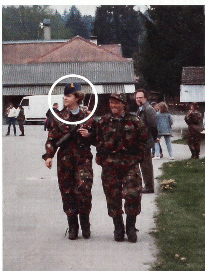
Militärdienst in Schönbühl.

in Genieschulen, Hochschulen und an öffentlichen Veranstaltungen über den MFD referiert. Ich war eine der sechs Aushebungs-offiziere der Schweizer Armee.»