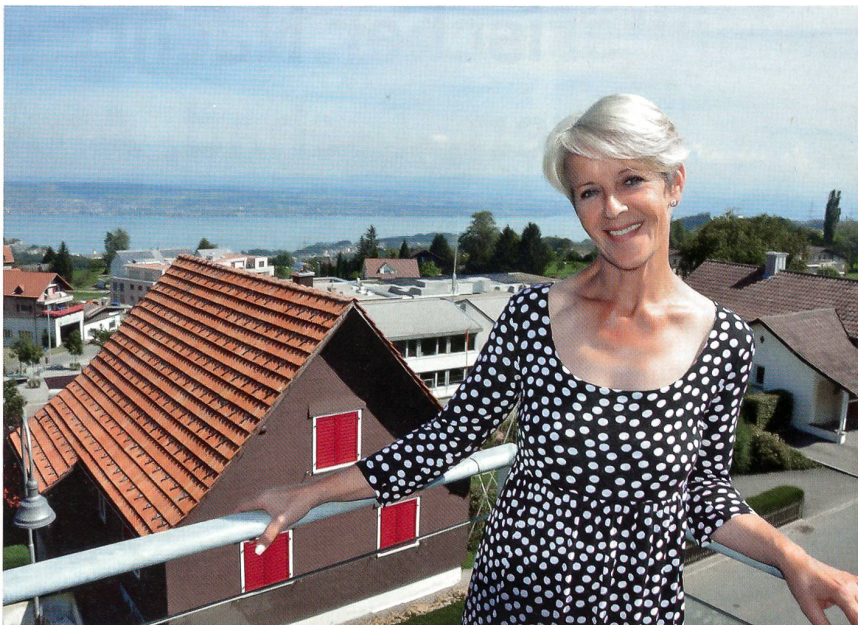
Mit schöner Aussicht auf den Zürichsee.