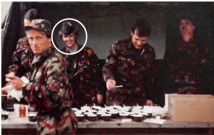
Gut gelaunt beim Abverdienen im Jahr 1980.