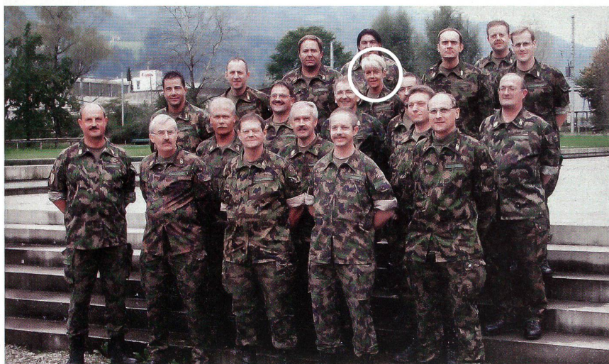
Anlässlich der Fachausbildung im AAL Luzern im Jahr 2005.