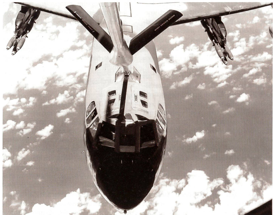
Ein B-52-Bomber wird durch eine KC-135A luftbetankt. An den Aussenstationen führt der Bomber Mk 82 Bomben mit.

Die B-52 aus Thailand brauchten für ihre etwa dreistündigen Einsätze in der Regel keine Luftbetankung, die B-52 aus