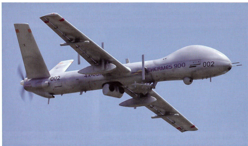
Der eine israelische Konkurrent: Die Drohne von Elbit, Hermes 900.

Das neue Drohnensystem soll grundsätzlich jene Aufgaben erfüllen, die bereits die ADS 95 erbringt. Die wichtigste Aufgabe bleibt die Nachrichtenbeschaffung für die Armee. Daneben leisten die Drohnen unter anderem ausgezeichnete Dienste für das Grenzwachtkorps.