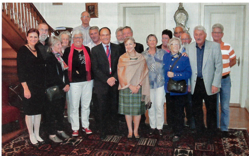
Der UOV Zürich beim Schweizer Botschafter mit Nationalrätin Doris Fiala (links).