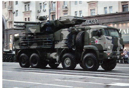
Fliegerabwehrsystem Panzir-S anlässlich einer Militärparade in Moskau.

Die russische Luftabwehr hat bei einer Übung erstmals einen echten Marschflugkörper mit modernsten Abfangraketen des Typs Panzir-S abgefangen. Bislang wurden