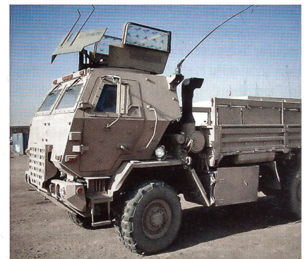
Geschützter Geländelastwagen des Herstellers Oshkosh Defence.

Oshkosh Defence hat in zwei Jahren Vertragsdauer 10 000 Fahrzeuge der Kategorie «Taktischer LKW» ausgeliefert. Die Fahr-