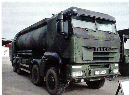
Geschützter Tankwagen des Typs Iveco Trakker der Bundeswehr.

Die Bundeswehr erhält 13 LKW des Typs Trakker von Iveco mit Pritschau Aufbau und geschützter Fahrerkabine. Die Fahrzeuge gehören zu den geschützten Transportfahrzeugen