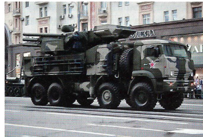
Fliegerabwehrsystem Panzir-S anlässlich einer Militärparade in Moskau.

Die russische Luftabwehr hat bei einer Übung erstmals einen echten Marschflugkörper mit modernsten Abfangraketen des Typs Panzir-S abgefangen. Bislang wurden