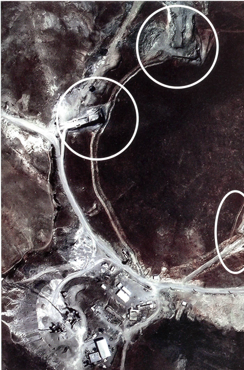
Eine felsige Hügellandschaft, braune Erde, graue Strassen, ein paar Häuser – mehr ist auf den ersten Blick nicht zu sehen. Bei genauerem Hinsehen zeigt das Satellitenbild indessen eine iranische Atomanlage nordwestlich der Hauptstadt Teheran. Unten mehrere Gebäude der Einrichtung, die den Revolutionsgarden gehört. Die Strassen führen zu den Eingängen von Stollen. Zwei Stollen sind in der oberen Bildhälfte erkennbar, einer angeschnitten am rechten Bildrand knapp auf halber Höhe.

Für die CIA und die amerikanischen Streitkräfte kommt der Sentinel-Abschuss einer Niederlage gleich. Die amerikanische Air Force rüstet gegenwärtig intensiv für die Eventualität eines Luftschlages gegen Iran. In der zweiten November-Hälfte übernahm sie eine neue gewaltige Blockbuster-Waffe, unter dem Titel Massive Ordnance