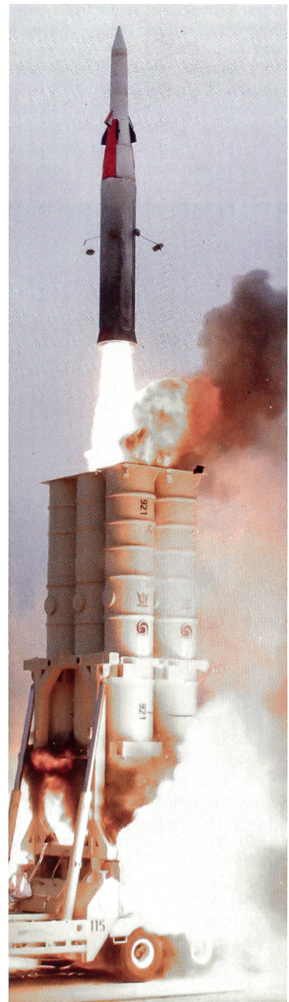
Start einer israelischen Arrow-Rakete. Israel und die USA erlitten einen Rückschlag, als die Iraner eine Sentinel-Drohne abfingen. Womöglich wurde das GPS-Signal gejammt oder gar gespoof. Sollte sich das bewahrheiten, wären israelische und amerikanische Bunkerbuster, JDAM-Waffen, aber auch die neuen MOP gefährdet; alle sind GPS-gesteuert.

Einen Erfolg erzielte die iranische Fliegerabwehr am 4. Dezember 2011 gegen eine amerikanische Aufklärer-Drohne vom Typ RQ-170 Sentinel. Dank moderner elektro-