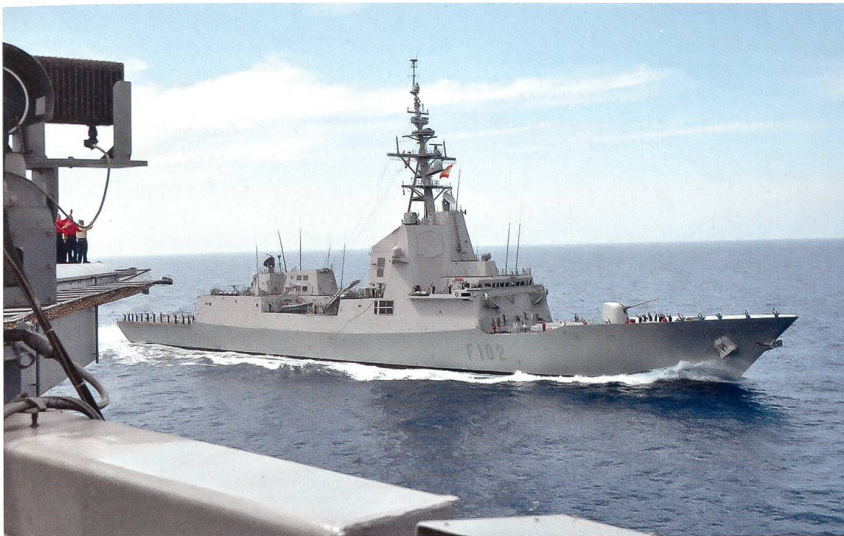
Die spanische Fregatte «Almirante Juan de Borbon» (F 102) war stets in Sichtweite des Flugzeugträgers GHWB und bildete dessen unmittelbaren Schutzschirm.