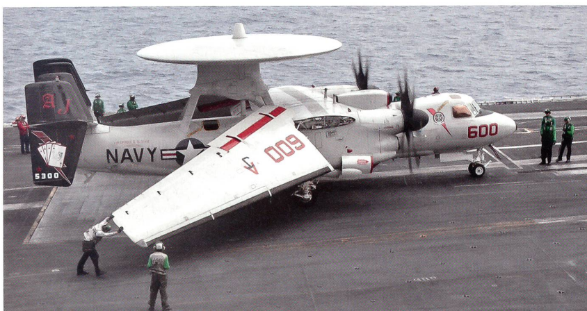
Eine Radarfrühwarnmaschine des Typs E-2C Hawkeye der Staffel VAW-124 rollt zum Katapultstart.