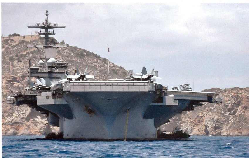
Der neueste Atomflugzeugträger der US Navy, die USS «George H.W. Bush» (CVN 77), ankert vor der spanischen Stadt Cartagena, bereit zum Auslaufen. An Bord sind gegen 70 Flugzeuge des Marinefliegergeschwaders 8.

Die aufflammenden Unruhen in Ägypten, Tunesien und Libyen sollten keinen Einfluss auf die geplanten Übungsaktivitä-