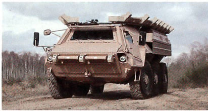
Transportpanzer Fuchs mit aktivem Schutzsystem ADS.

Kürzlich hat Rheinmetall ihre innovative Schutztechnologie für Einsatzfahrzeuge gegen Panzerabwehrwaffen, Lenkflugkörper sowie Explosively Formed Projectiles (EFPs, eine besonders tückische Form improvisierter Sprengladungen), welche die gefährlichsten Bedrohungen in den heutigen militärischen Einsätzen darstellen, demonstriert. Wirkungsvollen Schutz hiergegen soll das neu entwickelte abstandsaktive