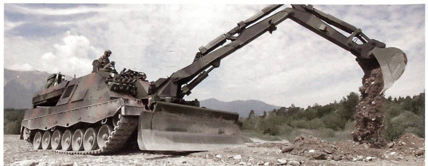
Schweden: Pionierpanzer Kodiak bei Erdarbeiten mit der Knickarm-Baggeranlage.

Das minengeschützte Leopard-2-Fahrgestell und der 1500 PS starke Dieselmotor bieten hervorragende Mobilität. Das Fahrzeugkonzept basiert auf einem Umbau von gebrauchten Fahrgestellen des Kampfpanzers Leopard 2 und verfügt über folgende Hauptarbeitsgeräte: Knickarm-Baggeranlage mit einer Schnellwechsellösung für die Arbeitsgeräte, eine vier Meter breite Dozeranlage, zwei Seilwinden mit je neun Tonnen Zugkraft und 200 m Seillänge und der Möglichkeit der Erhöhung der Zugkraft mit Umlenkrollen sowie eine Minenräumanlage,