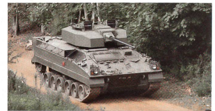
Bild eines WCSP-Versuchsträgers.

Lockheed Martin UK wurde mit der Kampfwertsteigerung des britischen Kampfschützenpanzers Warrior beauftragt. Mit dem umfassenden Warrior Capability Sustainment Programme (WCSP) erhält die zwanzig Jahre alte Fahrzeugfamilie Warrior neue Fähigkeiten für eine verlängerte Lebensdauer bis mindestens 2040. Von den 789