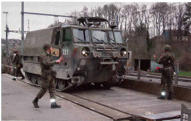
Immer eine Herausforderung: Der Bahnverlad.