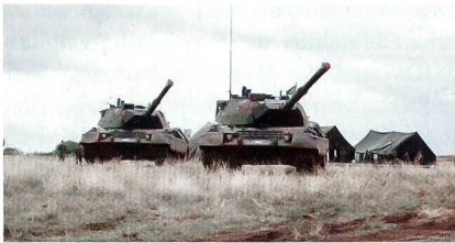
Leopard 1A5 der Brasilianischen Armee.

Durchgeführt wird der Schwerpunkt der Arbeiten von der neu gegründeten KMW-Tochter KMW do Brasil in Santa Maria (Brasilien). Die Vereinbarung schliesst mehr als 220 Leopard 1A5, weitere Fahrzeuge der Leopard-Familie und zahlreiche Simulatoren und Ausbildungsgeräte mit ein. KMW wird den grössten Teil der Arbeiten in enger Zusammenarbeit mit dem neuen, im Aufbau befindlichen Entwicklungs-, Ferti-