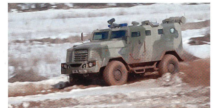
SPM-3 Medwed bei der Erprobungsfahrt im Gelände.

Im Auftrag des russischen Verteidigungsministeriums wird durch VPK derzeit ein einheitliches gepanzertes Räder-Fahrgestell für eine ganze Gattung von neuen Fahrzeugen entwickelt. Es ist geplant, den Grossteil