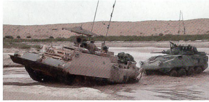
Bergepanzer Büffel im Einsatz in Afghanistan beim Bergen eines LAV-III.

Rheinmetall ist von den kanadischen Streitkräften mit der Lieferung von hochmodernen Bergepanzern des Typs Büffel beauftragt worden. Rheinmetall hat diesen wichtigen Auftrag mit einem Volumen von rund 40 Millionen Euro im Wettbewerb gewonnen und unterstreicht damit seine führende Rolle im Bereich der schweren gepanzerten Unterstützungsfahrzeuge. Damit gelingt es Rheinmetall erneut, im kanadischen Markt einen bedeutenden Auftrag zu platzieren.