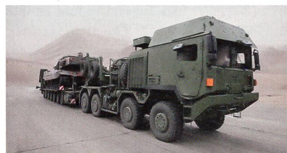
Geschützter Schwerlasttransporter HX 81 transportiert einen Kampfpanzer Leopard 2 auf einem Tieflader.

Der nun unter Vertrag genommene Auftrag der Bundeswehr hat einen Nettowert von etwa 12 Millionen Euro und umfasst neben zwölf Fahrzeugen auch Pakete zur Ausbildung sowie zur Werkzeug- und Ersatzteillieferung. Bis Ende 2013 sollen alle Sattelzugmaschinen von RMMV an die Truppe übergeben werden. Aufgebaut ist das Fahrzeug auf einem 8x8-Fahrgestell der MAN-HX-Baureihe, die sich im Einsatz z.B. bei den britischen Streitkräften seit langem bewährt. Anforderungen der Bundeswehr wurden bereits in der Entwicklungsphase besonders berücksichtigt: Ein Euro-5-V8-Motor mit einer Leistung von 500