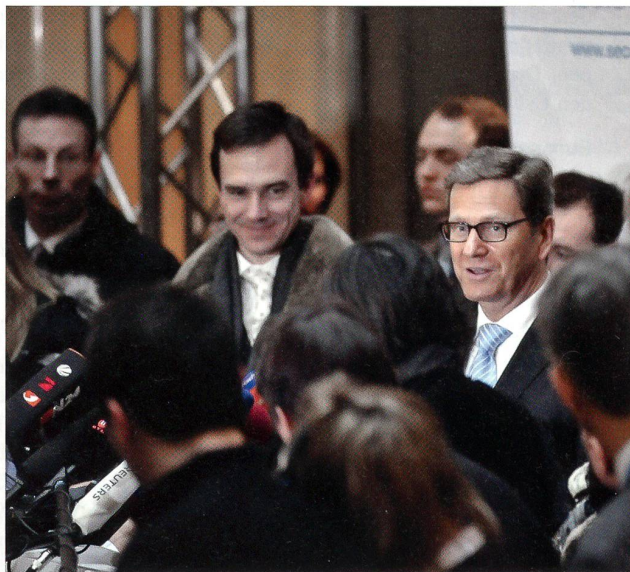
Aussenminister Westerwelle stellt sich den Korrespondenten.

Hof. Die Staatssekretärin suchte ihren russischen Widerpart in Anbetracht der Hiobsbotschaften aus Homs zum Einlenken und einer schnittigen Resolution zu bewegen.