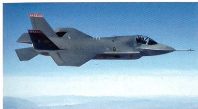
Testflugzeug Lockheed Martin X-35A.

Der Vertrag sieht vier Flugzeuge für das Fiskaljahr 2012 vor, das am 1. April 2012 beginnt. Ein wichtiger Punkt für das F-35-Programm ist seine weltweite Nutzung. Diese trägt zu seinem Erfolg bei und macht das Flugzeug aufgrund der Wirtschaftlichkeit durch Massenproduktion erschwinglich. Das Programm ist in neun Partnerschaften eingeführt: USA, Grossbritannien, Italien, Niederlande, Türkei,