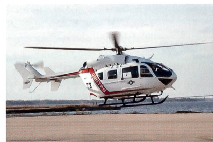
H-72A Lakota der US Naval Test Pilot School im Landeanflug.

EADS North America hat einen Auftrag über die Lieferung von 29 UH-72A Lakota Light Utility Helicopters (LUH) im Rahmen des Gesamtkaufvertrages im Wert von 212,7 Millionen US-Dollar erhalten. Davon werden 32 Lakotas in der speziellen Konfiguration für die US Army (Security