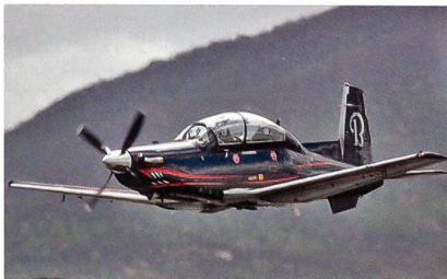
Trainingsflugzeug Beechcraft T-6C+ für die mexikanische Luftwaffe.

Hawker Beechcraft Defense Company (HBDC) hat den ersten Verkauf des neuen