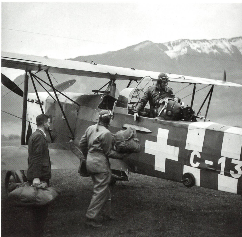
Eine C-35 der Schweizer Luftwaffe wird mit Hilfsgütern beladen.

Eine neuerliche trianguläre Funkmessung soll einen genaueren Standort der vermissten C-53 ergeben. Wie vorgängig abgemacht und im Wissen darum, dass sich die Batterie zu Ende neigt, drückt der Funker um 18 Uhr während zweier Minuten auf sein Funkgerät. Die neue von drei Stationen vorgenommene Peilung ergibt als Absturzstelle ein Standort im Dreieck Airolo-Sion-Jungfrau und somit innerhalb der Schweiz. Nach dieser Peilung sind die Batterien des Funkgerätes fast «am Boden». Der letzte Funkspruch folgt um 18.30 Uhr und besagt, dass sie nur noch 24 Stunden durchhalten können.