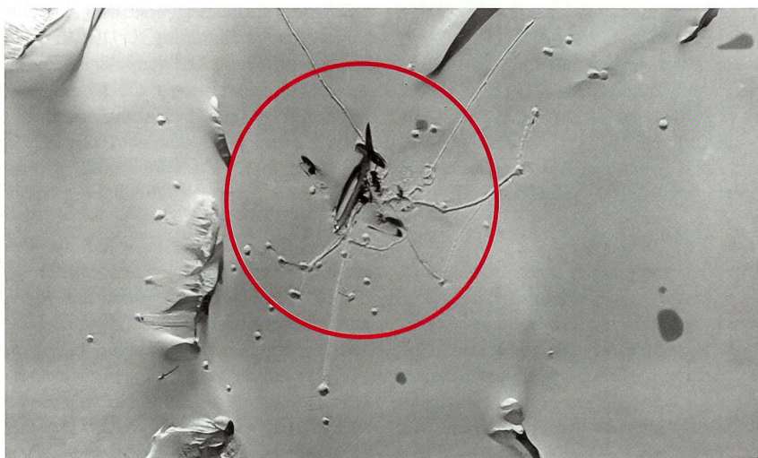
Die mit Schnee bedeckte C-53 auf dem Gletscher aus der Luft. Gut erkennbar ist der rechte Flügel, der bei der Crash-Landung leicht abknickte. Die «Einschlaglöcher» im Schnee stammen von den abgeworfenen Hilfsgütern. Wegen der Gletscherspaltengefahr konnten nach dem Abwurf die Güter nicht geborgen werden. Einer der Kohlen-säcke traf zum Beispiel die Maschine selbst.

Eine britische Lancaster wird losgeschickt und am kommenden Morgen soll eine Rettungskolonnie aufbrechen. Auch in Italien wird das Flugzeug vermutet und