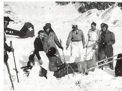
Die erfolgreiche Rettungsaktion war die Geburtsstunde der heutigen REGA.

Ihr Aufstieg wird um sieben Stunden verlängert! Ein Biwak ist nicht mehr ausge-