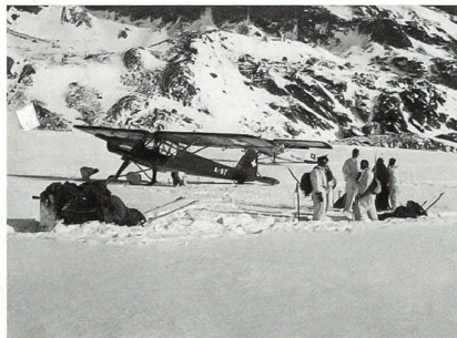
Die A-97 wird für den Abtransport eines Passagiers vorbereitet.

Während die einen wollen, dass sofort losmarschiert wird, weisen andere darauf hin, dass es in der Nacht zu gefährlich ist. Auch in Bezug auf das mitzunehmende Material sind sich die Verantwortlichen nicht einig. Es wird unter anderem befohlen, keine Skier mitzunehmen. Zum verteilten Rettungsmaterial von über 30 Kilogramm sollen auch noch 18 Rettungsschlitten mitgezogen werden! Um 4.15 Uhr marschiert die 50 Mann starke Kolonne los. Eine