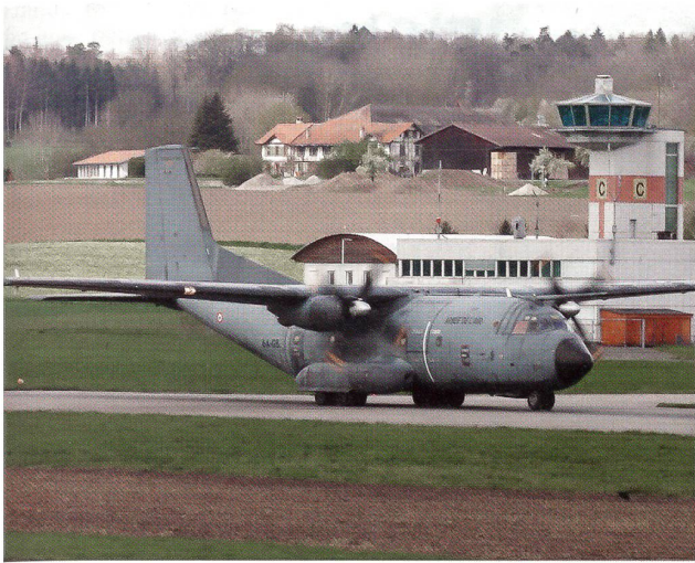
C-160 vor dem Kontrollturm in Payerne.