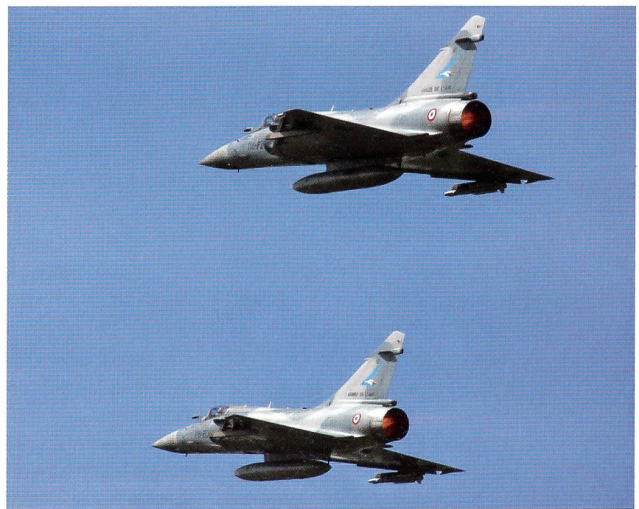
Zwei Mirage 2000 – mit Libyen-Erfahrung.