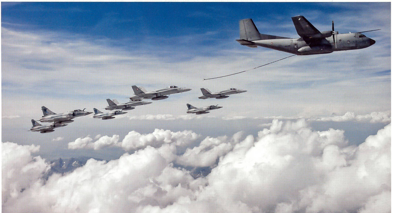
C-160 Transall und Mirage 2000 aus Frankreich sowie F/A-18 der Schweizer Luftwaffe in Formation.