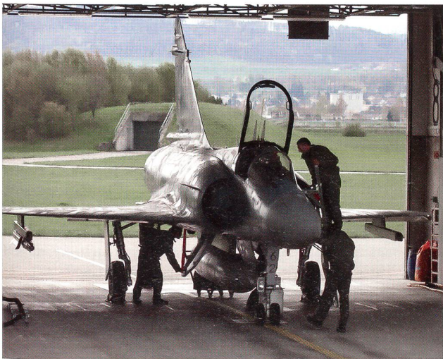
Mirage 2000 von einer Mission zurück.