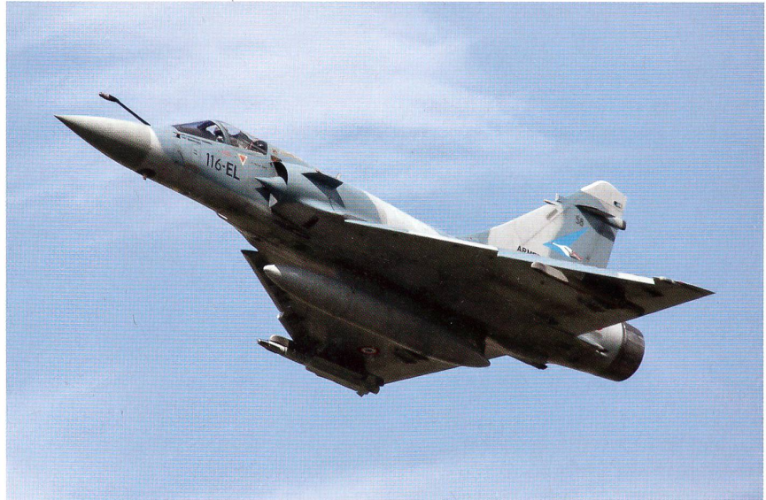
Start Mirage 2000: Das Jagdgeschwader 1/2 in Payerne.