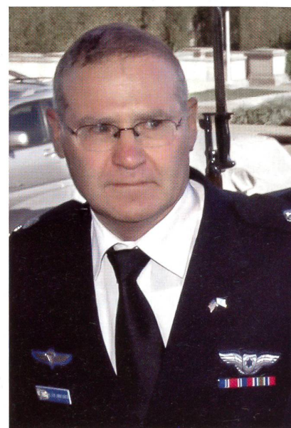
Amos Yadlin mit dem Fallschirm- und dem Pilotenabzeichen. Sichtbar die Ribbons für den Jom-Kippur-Krieg (1973) und den Libanon-Feldzug (1982). Yadlin flog 250 Kampfmissionen und hat 5000 Flugstunden. Er war Attaché in Washington und Chef des militärischen Nachrichtendienstes. Von der Negev-Uni hat er den Bachelor in Wirtschafts-, von Harvard den Master in Staatswissenschaft.

Daher haben sie mehr Zeit, festzulegen, wann der Moment der Entscheidung gekommen ist. Was wir brauchen, ist eine klare Zusicherung, dass im Falle eines israelischen Zuwartens und des Scheiterns aller Bemühungen, Teheran vom Atomkurs