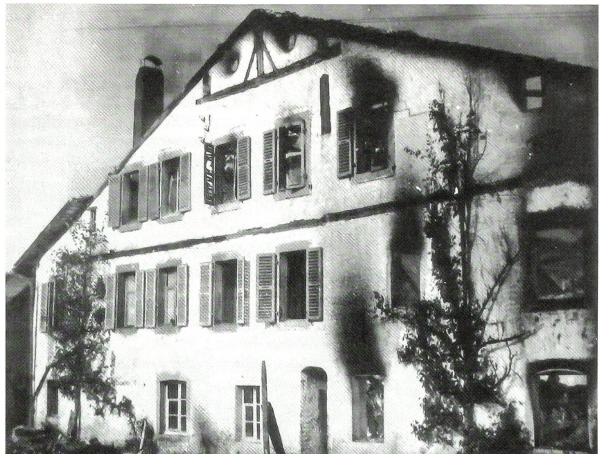
Das Brandobjekt West im zerstörten Zustand (historische Schwarz-Weiss-Aufnahme).

Von entfernten Fliegerbeobachtungsposten wurde gemeldet, dass acht Thunderbolts die CH-Grenze bei Sommètres überflo-