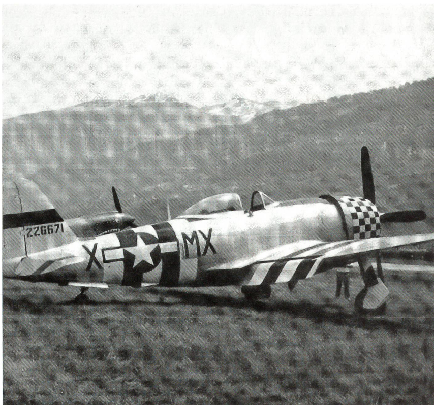
Eine Thunderbolt P-47 der damals noch jungen US-Luftwaffe.

geliefert und dafür beim Bundesrat mehrmals Protest eingelegt. Das Andenken an diesen Fliegerangriff verewigte die Dragonerschwadron 24 auf ihrer Soldatenmarke (Kat. Nr. 28, galoppierender Meldereiter) mit dem dreizeiligen, roten Überdruck