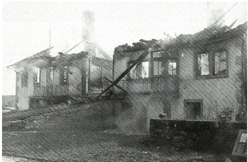
Das Brandobjekt Ost in ausgebranntem Zustand – nur die Grundmauer stand noch.

gen und sich in zwei Doppelpatrouillen aufgeteilt hätten. Zwei Flugzeuge der einen Formation führten den Angriff aus Nordnordost auf Le Noirmont aus, indem sie im Tiefflug auf 30 m über Grund und bei einer Geschwindigkeit von gut 500 km/h ihre Ziele anvisierten und beschossen. Der ganze Angriff dauerte höchstens 20 Sekunden.