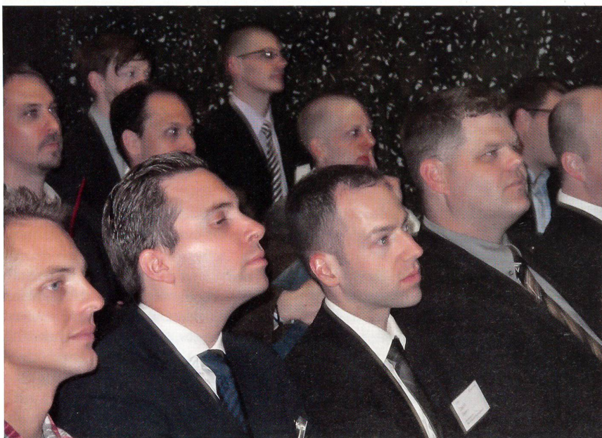
Studenten und Absolventen der Uni St. Gallen bei einem Vortrag des Armeechefs.