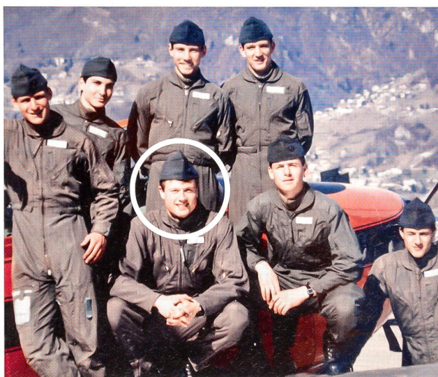
Die Piloten-Rekrutenschule 42 in der Magadino-Ebene 1989.