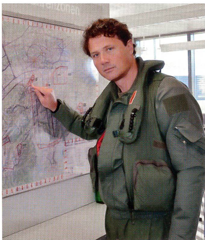
Vor dem Flug im Tower von Emmen.