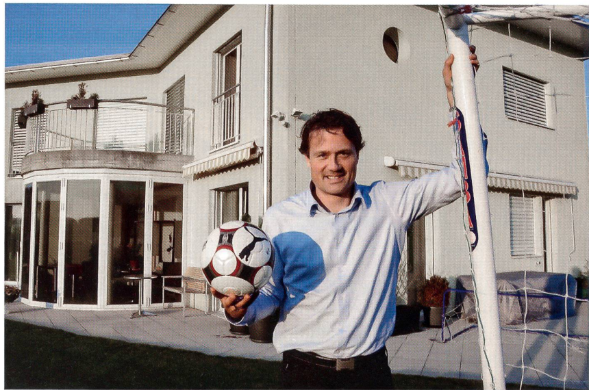
Vor dem Haus in Biberist. Im Garten stellte der Fussball-Sekretär ein Tor auf.

Am meisten habe ihn der Flug mit dem Vampire beeindruckt. «Beim Akrobatikfliegen bin ich wahnsinnig erschrocken, als es um mich unterschiedlich gerüttelt und gepfiffen hat. Ich dachte, der ist nicht ganz