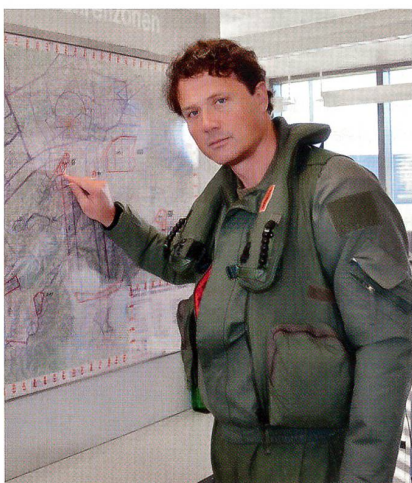
Vor dem Flug im Tower von Emmen.