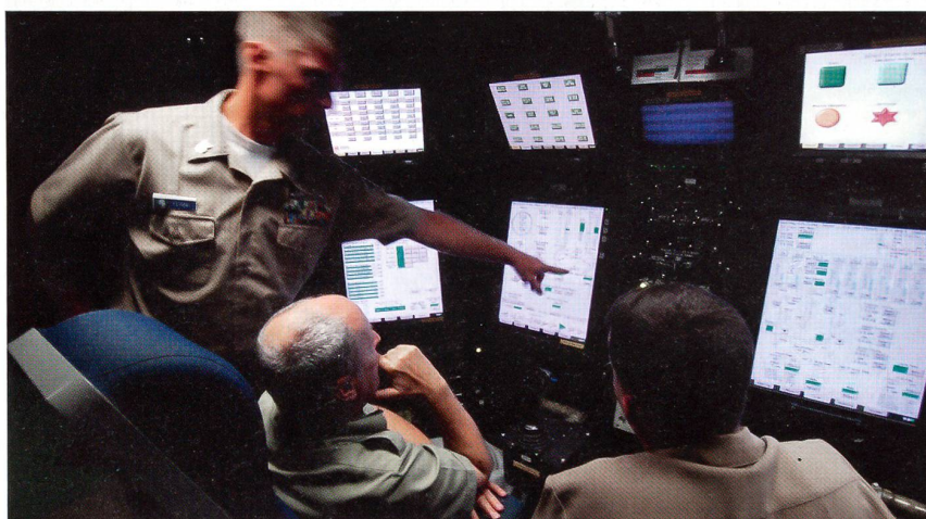
Die Submarine Learning Facility in Norfolk. Hier wird der Simulator der neuen «Virginia» U-Boot-Klasse demonstriert. Die traditionellen Tiefen- und Seitenrudern sind verschwunden. Die Fahrmanöver des U-Bootes werden voll digitalisiert elektronisch überwacht und mit Joystick gesteuert.

Diese können nun via Satelliten oder auch auf anderem Wege grosse Datenmengen sehr rasch austauschen. Solche Neuerungen dienen im übrigen auch anderen