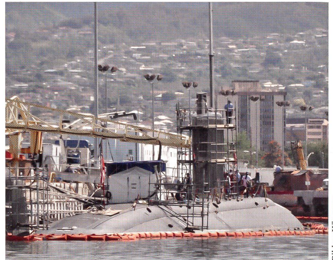
Am Jagd-U-Boot USS «Tucson» (SSN 770) werden im Hafen von Pearl Harbor Wartungsarbeiten ausgeführt. Auf der Hawaii-Insel sind mit 19 Einheiten am meisten Jagd-U-Boote stationiert.

Das geschieht in getauchtem Zustand des U-Bootes. Das ASDS fährt dann selbständig – immer noch untergetaucht – in Küstennähe und setzt die Seals ab. Nach erfolgter Mission kehren diese an Bord des ASDS zum U-Boot zurück.