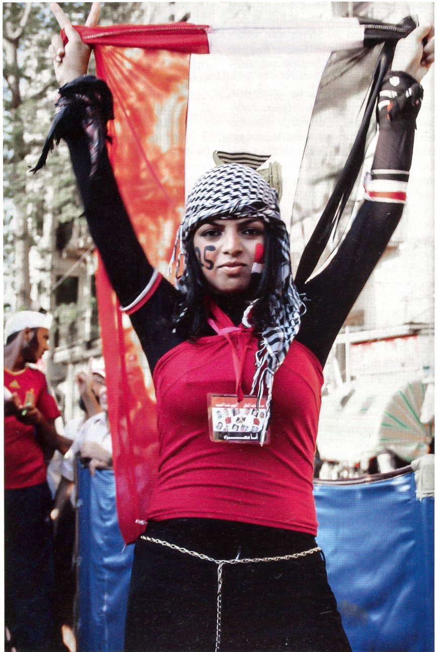
Die ägyptischen Frauen ringen um die Gleichstellung mit den Männern.

Eindrücklich war der letzte Tag, nach dem dann das Fasten gebrochen wird. Ich war