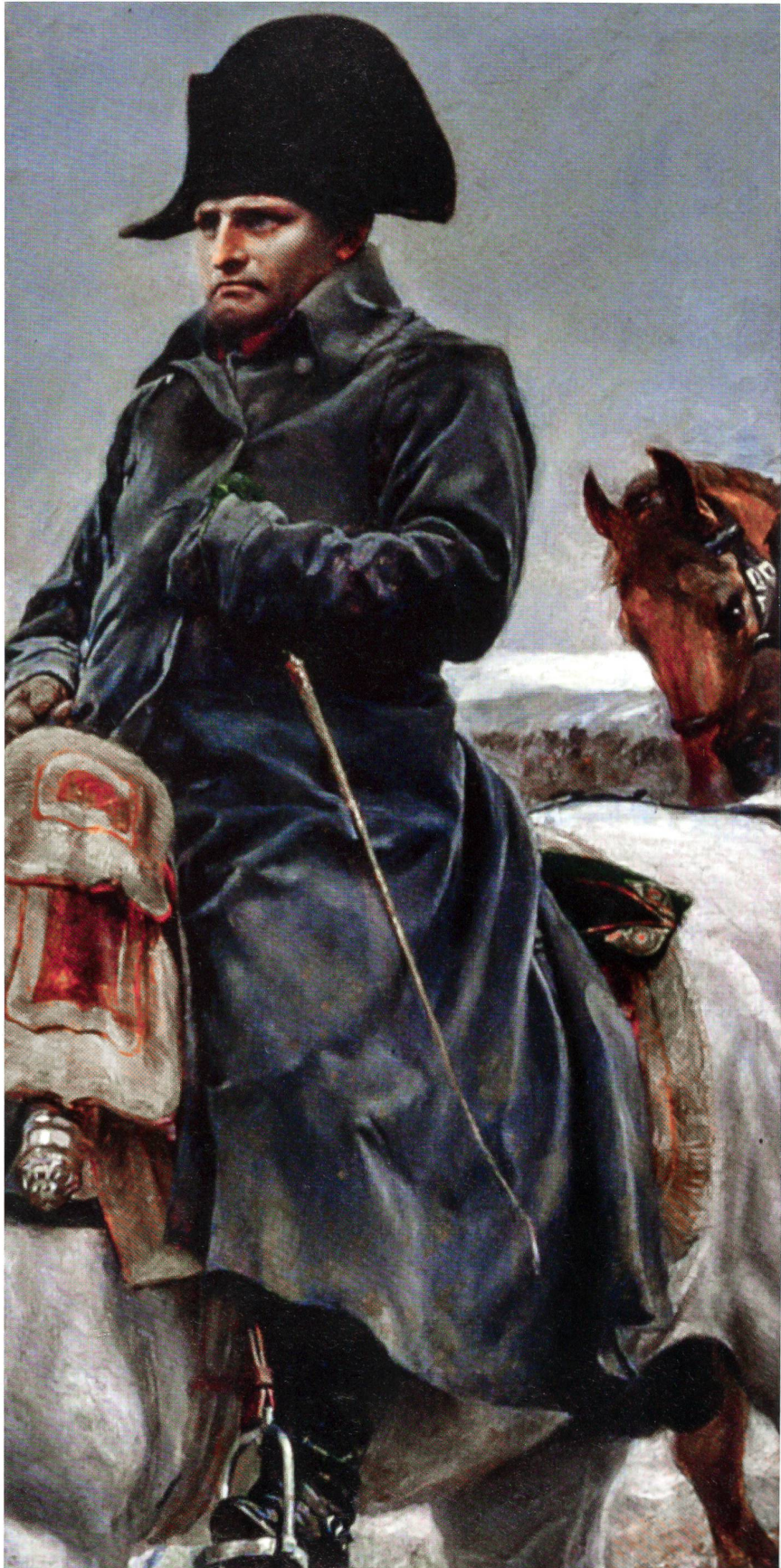
Napoleon in der Pose des unbezwingbaren Heerführers. Doch das Bild täuscht!

Am 30. November sinkt die Temperatur auf minus 30 Grad. Die Grosse Armee ist nur noch ein Haufen zerlumpter und ausgehungert Männer. Napoleon sucht von seinen strategischen Fehlern abzulenken und schiebt den Untergang seiner