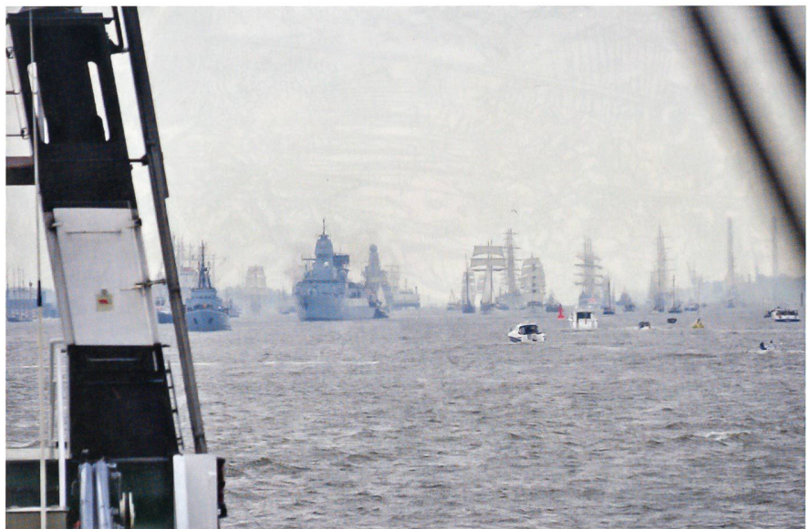
Hunderte von Schiffen, Grosseglern, Kriegsschiffen, Kreuzfahrtschiffen, Containerriesen und Kleinbooten stellen sich elbabwärts zur Einlaufparade nach Hamburg bereit.