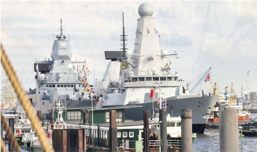
Nach der Einlaufparade haben die Raketenfregatte «Sachsen» und der brandneue britische Zerstörer «HMS Defender» (rechts) im Hafen von Hamburg festgemacht.