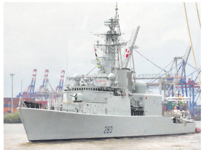
Als Gast des Hafenfestes von Hamburg läuft auch der kanadische Raketenzerstörer «HMCS Iroquois» ein.