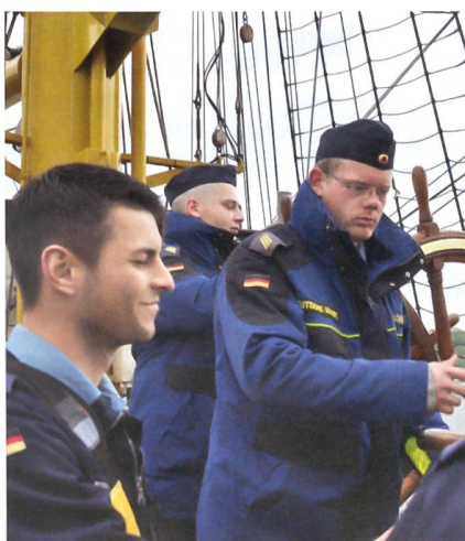
Bis zu sechs Seeleute betätigen sich als Rudergänger auf der «Gorch Fock», dem Segelschulschiff der deutschen Marine.