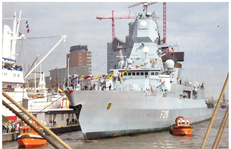
Blick von der «Gorch Fock» auf die moderne Raketenfregatte «Sachsen», die an den Landungsbrücken in Hamburg festgemacht hat.

In der Ferne entschwand Wilhelmshaven. Unter Führung des Kommandanten der «Sachsen», Fregattenkapitän Andreas Krug, ging es nun vorbei an der riesigen neuen Anlage des Jade Weserports in die Nordsee, vorbei an Helgoland und zahlreichen gut erkennbaren Windparks in Küstennähe. Nach einem wunderschönen Son-