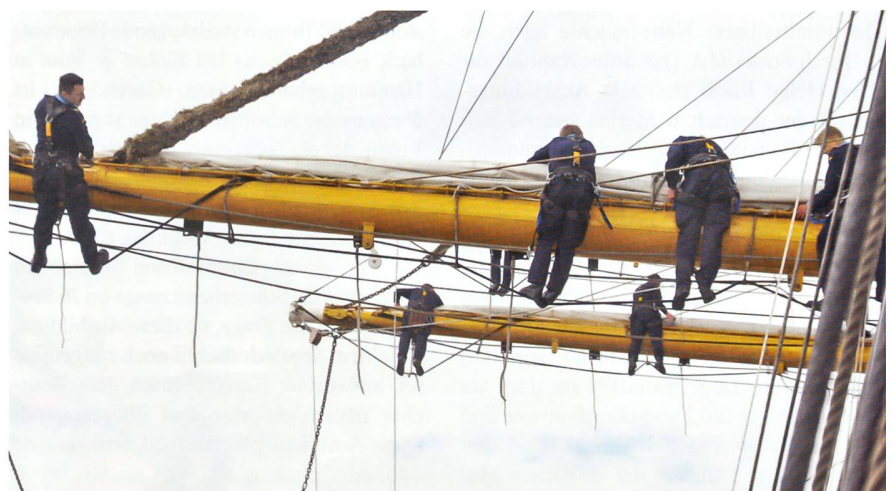
Keine Sache für schwindlige Leute. Seeleute des Segelschulschiffes «Gorch Fock» sind in die Takelage geklettert und sorgen – gut gesichert – dafür, dass ein Grosssegel wieder festgezurt werden kann.