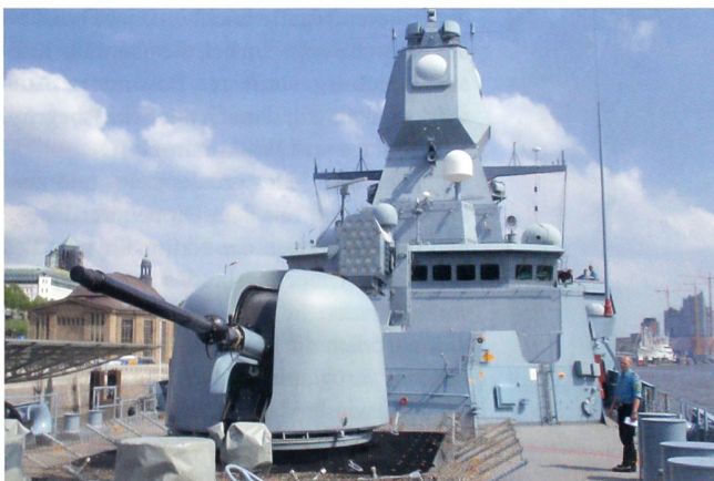
Das Vorschiff der «Sachsen» zeigt (von vorne nach hinten) das 76-mm-Oto-Melara-Geschütz, die verkleideten 32 Vertikalstart-Kanister für SM-2-Schiff-Luft-Lenk Waffen und ein RAM-System (mit 21 Raketen) auf.