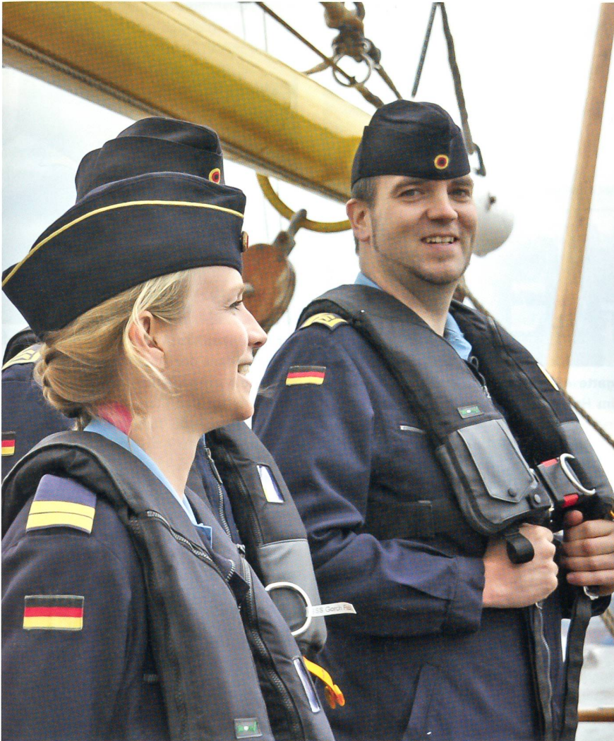
Zur Besatzung der «Gorch Fock» gehören auch weibliche Offiziere und Mannschaften, wie hier ein Oberleutnant zur See (vorne).

nenuntergang und einem ruhigen Nachtmarsch fuhr die «Sachsen» am folgenden Tag um 7 Uhr bei Cuxhaven in die Elbe ein.