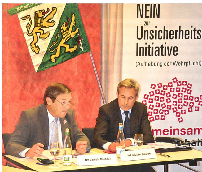
Pro Wehrpflicht: Die Nationalräte Büchler (CVP), Amstutz (SVP).