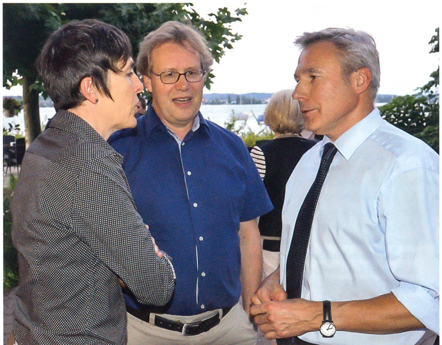
Vor dem Zanderessen am Untersee: Barbara Gysi, Joe Lang, Adrian Amstutz. Lang reimt: «Wir alle nehmen Zander, damit es gibt ein wenig Zunder.»

Als Mitinitiant der GSoA-Volksinitiative schob Josef Lang den Bundesrat vor. Dieser wisse, so Lang, dass der Verteidi-