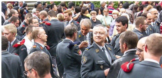
Der Schulterschluss ist vollzogen: Artillerie und Luftwaffe.