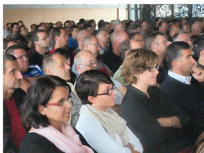
Aufmerksames, dankbares Publikum.