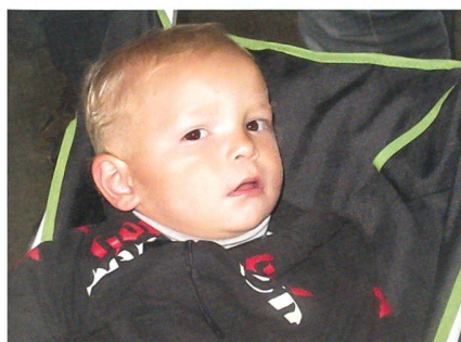
Keiner zu klein, Logistiker zu sein.