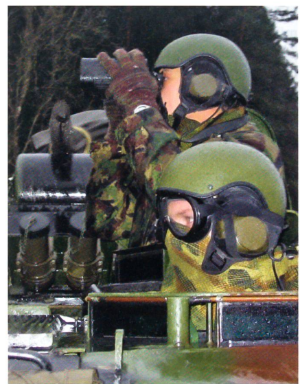
Strenge Ausbildung an der BUSA.

In der SUOV-Antwort scheint es auf den ersten Blick ein Nebenpunkt zu sein. Aber die neue Kopfstruktur enthält eine Nuance, die nicht unwidersprochen bleiben darf: An der Spitze der Berufsunteroffi-