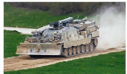
Der Bergepanzer Büffel rollt heran.