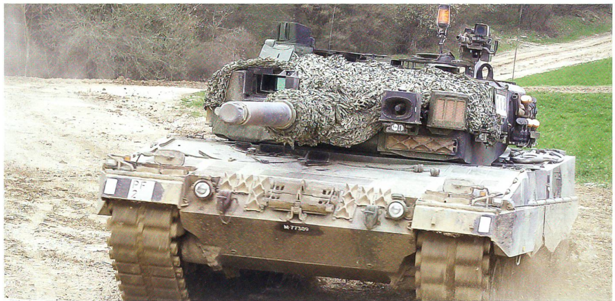
In Bure erhielt das Panzerbataillon 14 von der OSZE das Prädikat «sehr gut».

Danach erhielten die Besucher die Gelegenheit, den Angriff einer Panzerkompanie im Gelände zu beobachten, inklusive