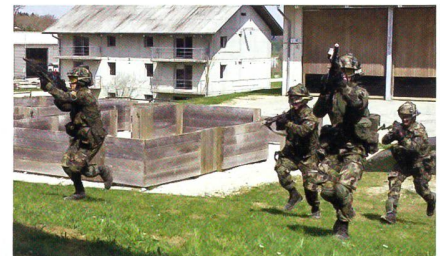
Im Häuser- und Ortskampfdorf Nalé.