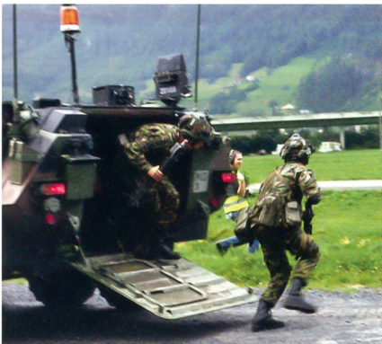
Aus dem Piranha-2: Auf in den Kampf!

hat. Ein Display und ein akustisches Signal informiert den Soldaten, wo er getroffen wurde und teilt ihm den Verwundungsgrad mit. Der früher so oft gehörte Ausspruch «Du wärst jetzt tot oder verletzt» entfällt und wird durch digitale Tatsachen ersetzt.