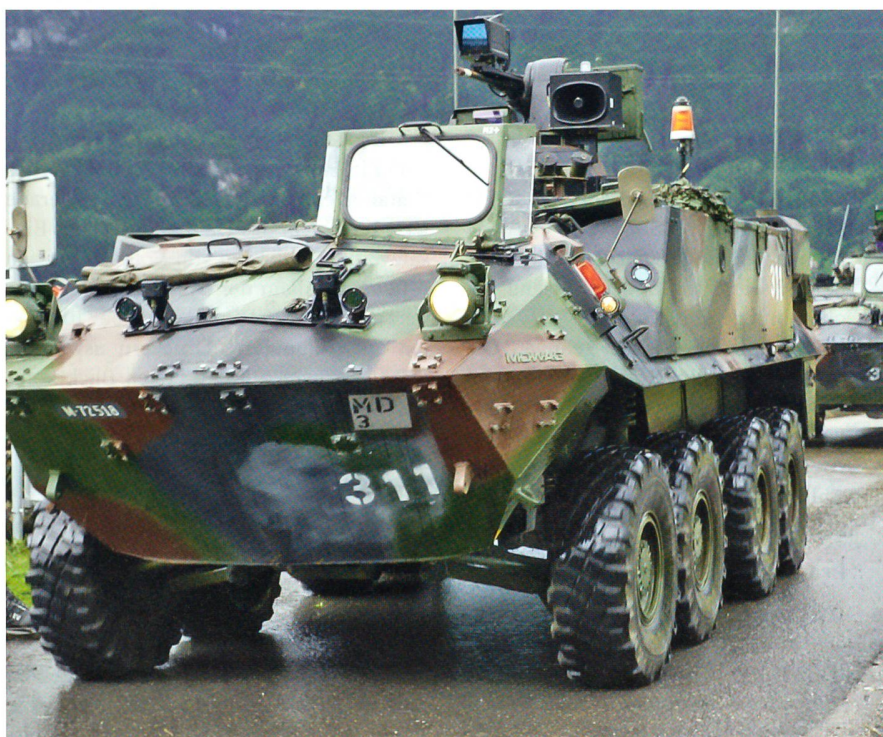
Auch im Geb Inf Bat 29 ist der Mowag-Piranha-2 das Kampffahrzeug des Bataillons.

Das Anlegen und Durchführen der Übung sowie die Auswertung für die Manöverkritik liegt in der Verantwortung des Übungsleiters und somit der Truppe. Gemäss Aussagen aller Kader ist der Lerneffekt sehr gross. Das Aeuli mit seinen tech-