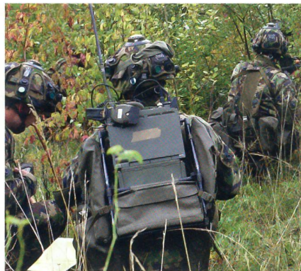
Man beachte die Sensoren am Helm.

Auch einzelne Sdt, Uof und Of werden getroffen, die Schwere der Treffer ist auf einem kleinen Bildschirm ablesbar. Die Sanitätspatrouille nimmt sich der Verletzten an. In dieser verfahrenen Situation entscheidet die Übungsleitung, dass abgebrochen und neu begonnen wird. Die angreifende Truppe kehrt in die Ausgangsstel-