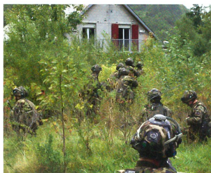
In der Annäherung an das Aeuli.