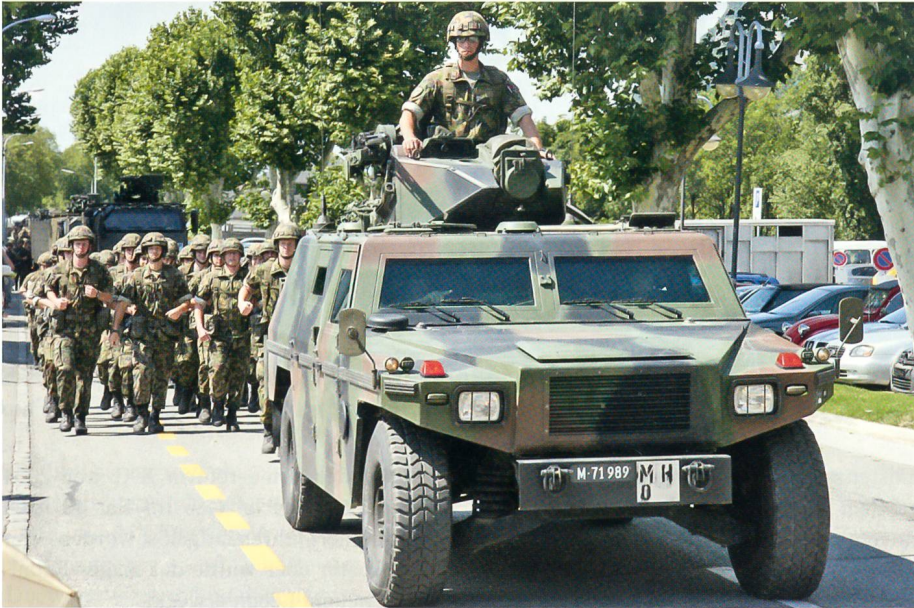
Vorbeimarsch: Der Bataillonskommandant auf dem Eagle; dahinter der Stab.