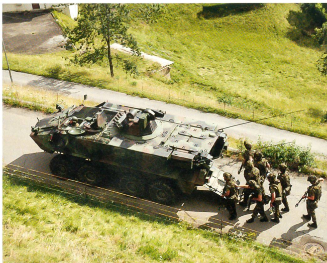
Die Infanteriegruppe mit dem Radschützenpanzer Piranha-2.