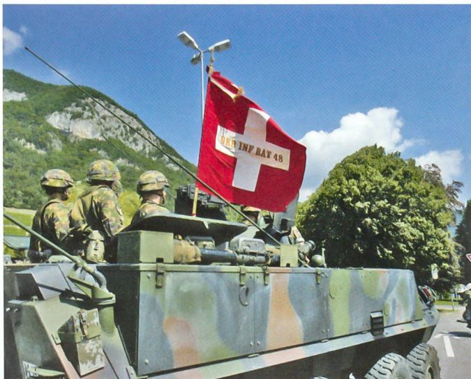
Armee zeigt Fahne: Das Gebirgsinfanteriebataillon 48.