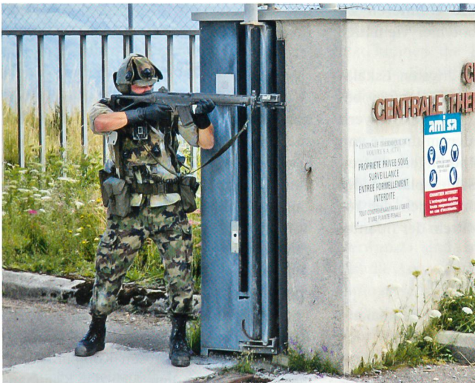
Chavalon: An der Pforte zur Centrale Thermique de Vouvry SA.