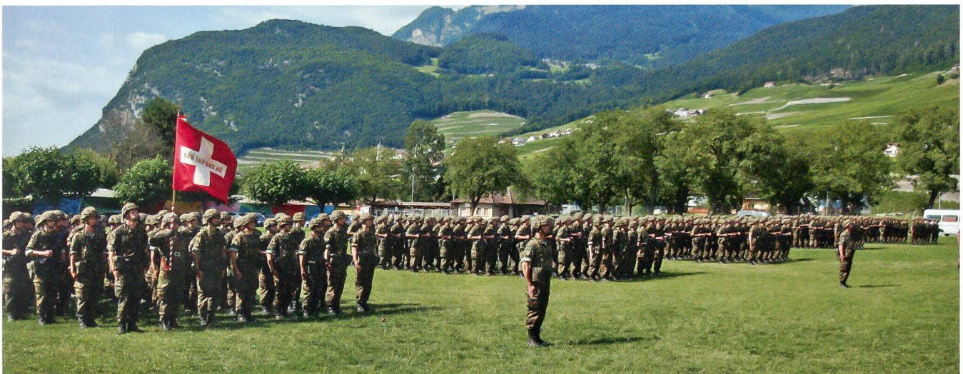
Wie immer ein festlicher Höhepunkt: Das Gebirgsinfanteriebataillon 48 bei der Fahnenzeremonie. Die Infanterie führt Fahnen.

Im Gespräch mit den Kompaniekommandanten erkundigte sich der Kommandant der Teilstreitkraft Heer nach dem