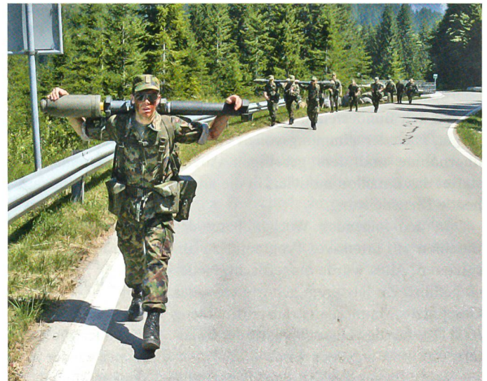
Tragen und Schlagen: Auf dem Buckel die Panzerfaust.