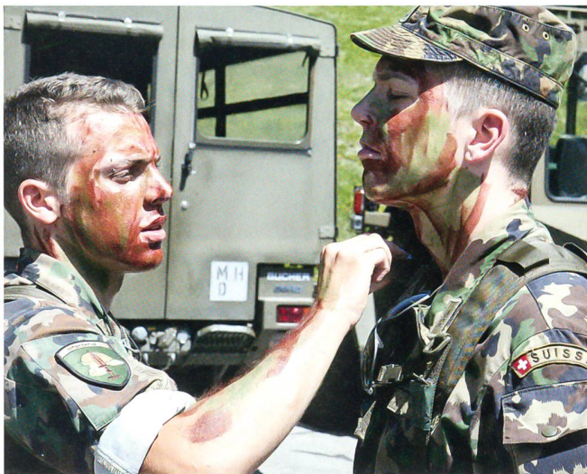
Tarnung gegen gegnerische Aufklärung: Das dunkle Gesicht.