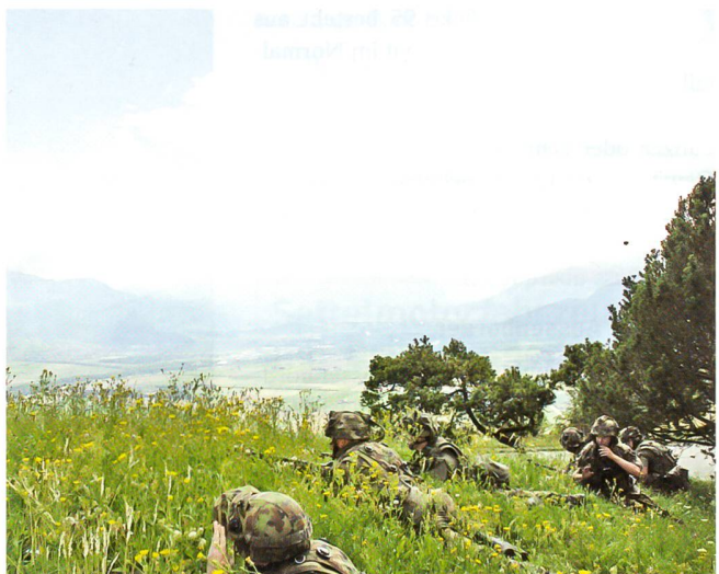
Die Infanteriegruppe in Deckung hoch über dem Rhonetal.