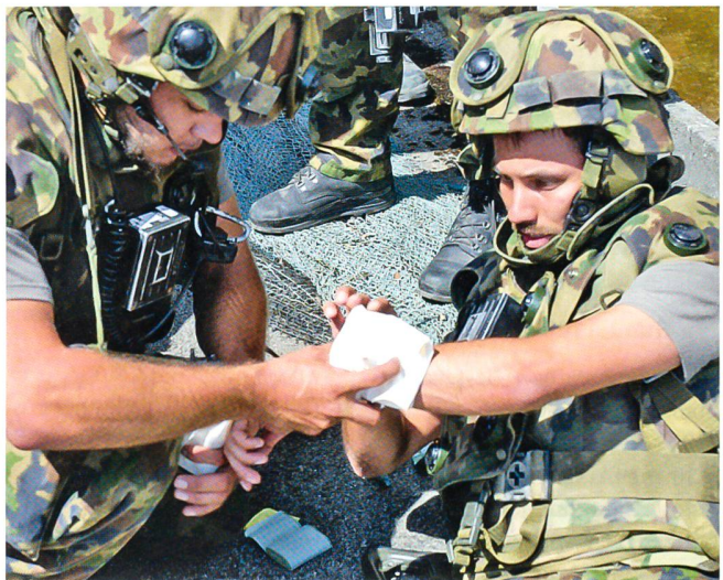
Gehört bei der Infanterie zum Alltag: Die Kameradenhilfe.