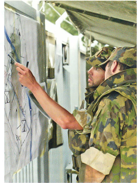
Die Planung an der Kartenwand.