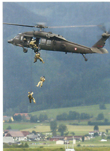
Black Hawk S-70 und Jagdkommando.