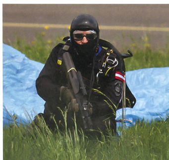
Ein Mitglied des Sonderkommandos Cobra geht in Stellung.