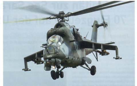
Kampfhelikopter MI-24 aus Tschechien beim Display.