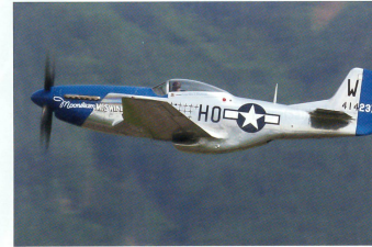
Oldtimerlegende P-51 Mustang bei der Vorführung.