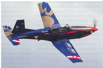
Österreichische PC-7 mit Sonderanstrich zum 30-Jahr-Jubiläum.