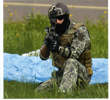
Ein Soldat des Jagdkommandos sichert ab.