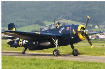
TBM-3E Avenger rollt zum Start.

Die Airpower 13 war in jeder Beziehung ausgezeichnet organisiert und bot den Zuschauern eine interessante und eindrucksvolle Flugveranstaltung. ☒