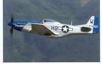
Oldtimerlegende P-51 Mustang bei der Vorführung.