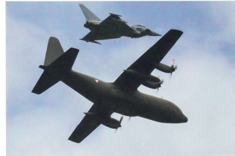
Eine C-130 Hercules wird von einem Eurofighter begleitet.