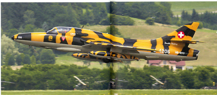
Der im Tigerlook bemalte Schweizer Hunter vom Fliegermuseum Altenrhein beim Start zur Vorführung.