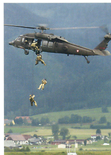
Black Hawk S-70 und Jagdkommando.