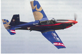
Österreichische PC-7 mit Sonderanstrich zum 30-Jahr-Jubiläum.