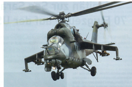
Kampfhelikopter Mi-24 aus Tschechien beim Display.