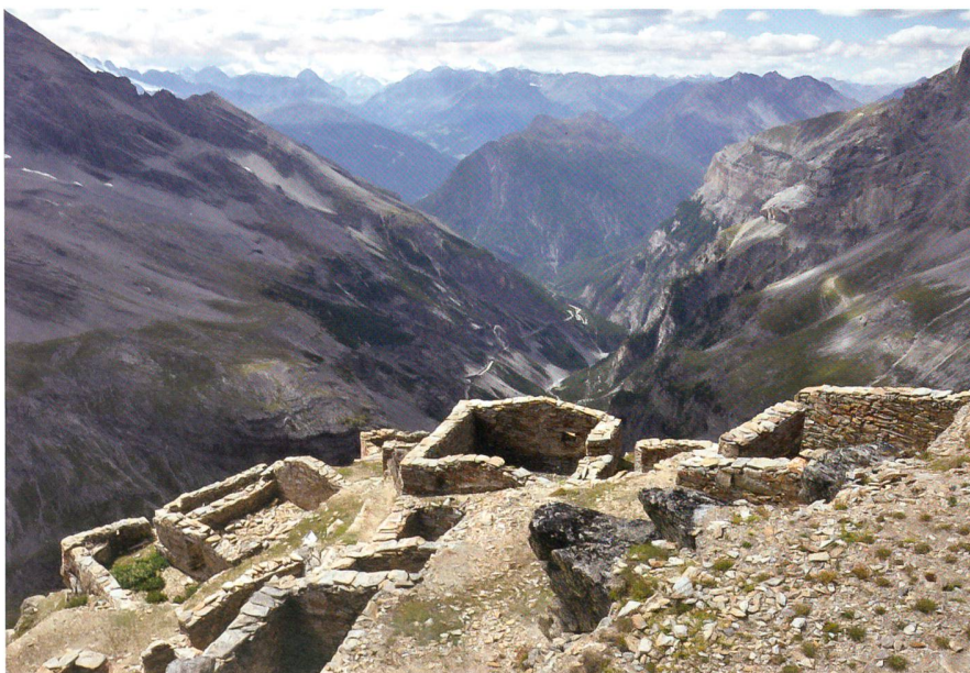
Eindrücklicher Blick in die Militärgeschichte: Alpini-Unterkunft am Filone-Scorluzzo.