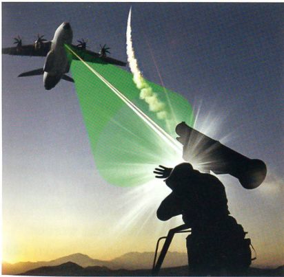
Kunstbild vom Einsatz des Cassidian-Schutzsystems.

Dabei ist die Verwendung eines augensicheren Lasers wichtig, um das System z.B. an Bord von Schiffen oder Hubschraubern auch in zivilem Umfeld – etwa in Häfen oder auf Flugplätzen – einsetzen zu können. Voraussetzung für einen effizienten