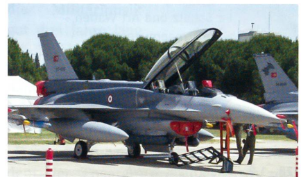
F-16D Block 50 der türkischen Luftwaffe.

Nach 25 Jahren endete bei Turkish Aerospace Industries der Lizenzbau der Fighting Falcon. 308 Flugzeuge verliessen die Halle in Akinci. Zuletzt lieferte TAI von Mai 2011 an im Rahmen des Peace-Onyx-IV-Programms 30 F-16C/D des neuesten Standards Advanced Block 50 aus (14 Einsitzer/16