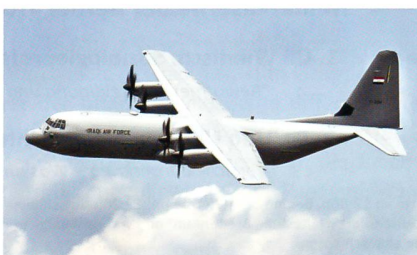
Start eines Transportflugzeuges C-130J Hercules der irakischen Luftwaffe.

Derzeit stehen den irakischen Luftstreitkräften sieben Piloten, ein Lademeister sowie 16 ausgebildete Mechaniker für die C-130J zur Verfügung. Innerhalb der nächsten