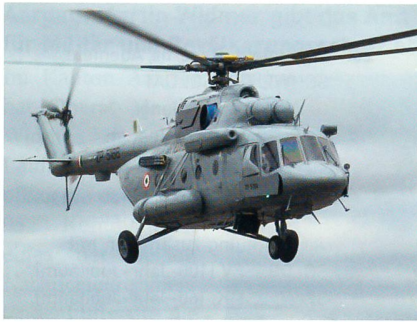
Moderner Transporthelikopter des Typs Mi-17B-5 der indischen Luftwaffe.

Bei einem Staatsbesuch des russischen Präsidenten Putin hat der indische Regierungschef einen Vertrag zur Lieferung von 71 Mi-17B-5-Helikoptern unterzeichnet. Ein Teil der Helikopter soll in Indien endmontiert werden. Dieser Vertrag kam auf die Minute pünktlich: Anfang 2013 sollte der russische Helikopterkonzern Russian Helicopters den letzten Helikopter vom Typ Mi-17B-5 des aktuellen Bauloses an die indischen